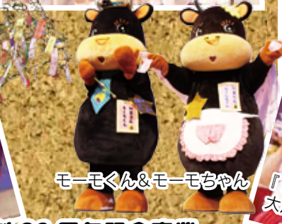
モーモくん&モーモちゃん