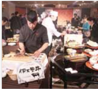
↑ホテルで提供されている伊万里産の食材を使った料理