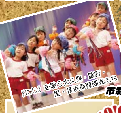
『にじ』を歌う大久保・脇野・ 里・長浜保育園児たち