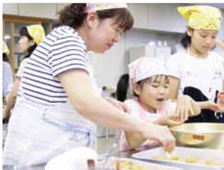
↑楽しそうにわらびもちを丸める親子