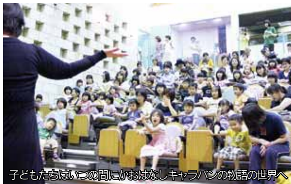
子どもたちといっしょの間におはなしキャラバンの物語の世界へ