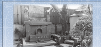
◆ ペットのお墓「君を忘れない」もとばに建立 (伊万里市幸善町・伊万里玉屋近く・伊万里川の畔)