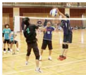
↑どの試合も好プレーの連続で、真剣勝負が繰り広げられました。

● 期 日 7月2日(水) 5月17日(木) ● 場 所 国見台体育館 第37回市長旗争奪ママさん ナイターバレーボール大会