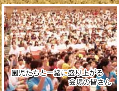
園児たちと一緒に盛り上がる 会場の皆さん