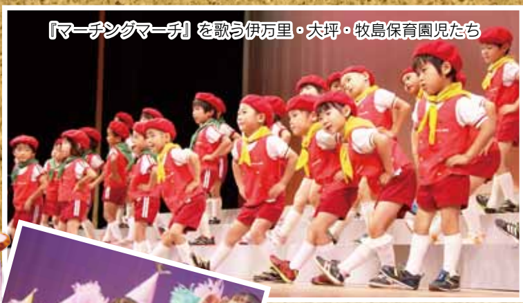
『マーチングマーチ』を歌う伊万里・大坪・牧島保育園児たち