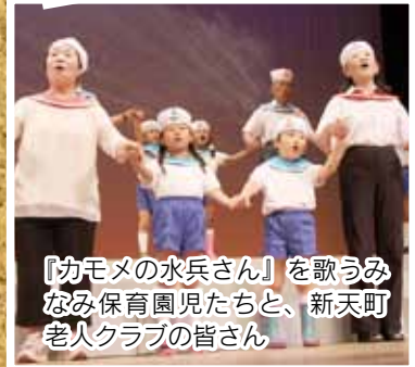
『カモメの水兵さん』を歌う なみ保育園児たちと、新天町 老人クラブの皆さん