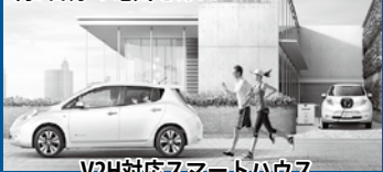
V2H対応スマートハウス