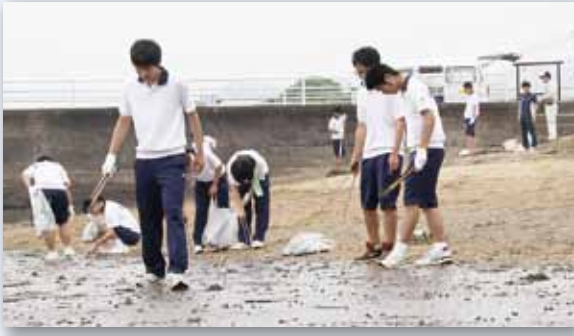
↑ 海岸へ漂着したごみを回収する伊万里高校の生徒

部と3年生約80人が参加。汗を流しながら、一つ一つごみを回収し、カブトガニを迎える準備を整えていました。