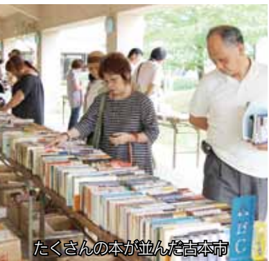
たくさんの本が並んだ吉本市