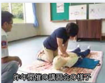
昨年開催の講習会の様子