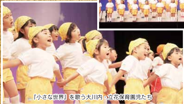
『小さな世界』を歌う大川内・立花保育園児たち