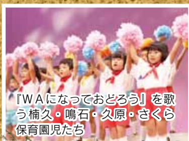
『WAになっておどろう』を歌 う楠久・鳴石・久原・さくら 保育園児たち