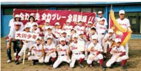
↑決勝戦で惜敗した昨年の大会の雪辱を果たし、優勝を喜ぶ大川少年野球の選手たち

● 期 日 6月21日(土)、22日(日)、28日(土) ● 場 所 国見台野球場