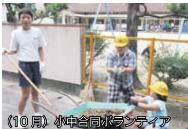
(10月) 小中合同ボランティア

中学生の毅然とした姿に学ぶ小学生、小学生に笑顔で優しく寄り添う中学生の姿が見られます。