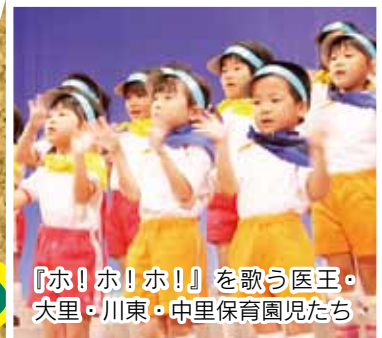
『ホ!ホ!ホ!』を歌う医王・ 大里・川東・中里保育園児たち