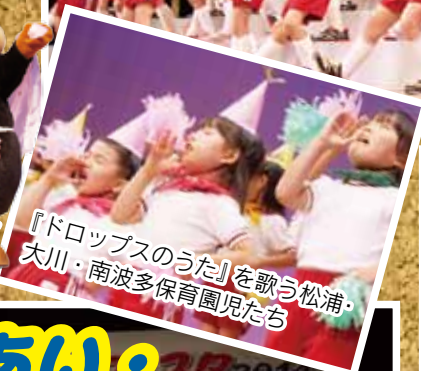
『ドロップスのうた』を歌う松浦・ 大川・南波多保育園児たち