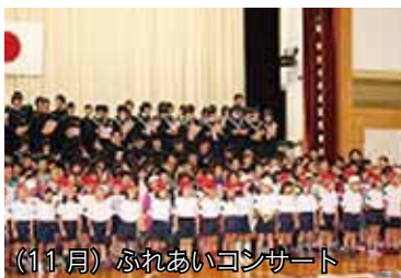
(11月) ふれあいコンサート

小・中学生が額に汗し、自分たちが住む『ふるさと南波多』に感謝の気持ちを届けます。