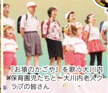
『お猿のかごや』を歌う大川内 保育園児たちと、大川内老人ク ラブの皆さん

7月6日、市民会館で『心ふれあい・うたフェスタ2014』が開催されました。市内23保育園の年長児357人が、立花町と大川内町の老人クラブの皆さんと一緒に参加。園児たちが、一生懸命に練習してきた歌や踊りを元気いっぱい披露すると、満員となった会場からは、惜しみない拍手が贈られていました。