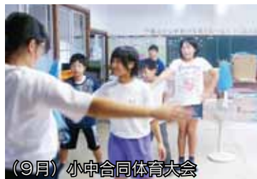
(9月) 小中合同体育大会