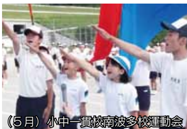
(5月) 小中一貫校南波多校運動会