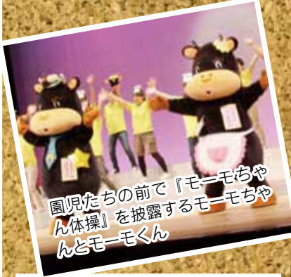
園児たちの前で『モーモちゃん体操』を披露するモーモちゃん とモーモくん