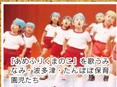
『あめふりくまのこ』を歌う なみ・波多津・たんぼぼ保育 園児たち