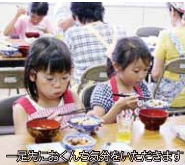
一足先におくunch気分をいただきます