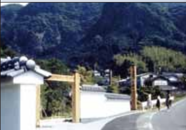
昭和 59 年 4 月 鍋島藩窯公園開園