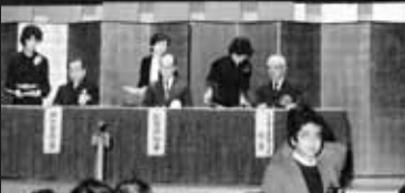
昭和 57 年 12 月 九州電子金属 (株) (現 SUMCO) 進出