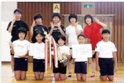
↑優勝した牧島地区の本瀬戸子ども会(左)と、南波多町の大川原子ども会(右)