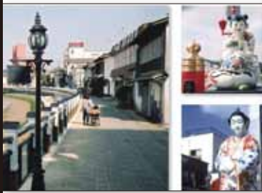
平成 6 年 4 月 古伊万里文化の香り漂う街づくり修景事業