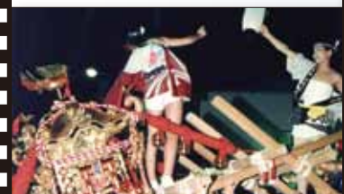
平成 2 年 8 月 第 1 回伊万里の夏・どっちゃん祭り開催