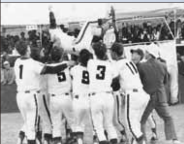
昭和 51 年 10 月 伊万里少年軟 式野球クラブが国体で優勝