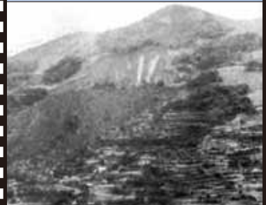
昭和 32 年 7 月 山代町人形石山地すべり