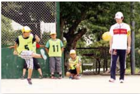
↑ホームランをねらって、思い切りキック！

8月9日、国見台球技場・体育館で市子ども会連合会球技大会が開催されました。この日、男子はキックベースボール、女子はミニバレーボールが行われ、市内各町(地区)の大会を勝ち抜いた男女各12チームが熱戦を繰り広げました。なお、上位の成績は以下のとおりです。