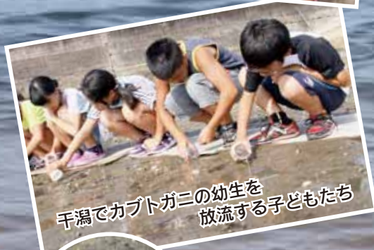
干潟でカブトガニの幼生を放流する子どもたち