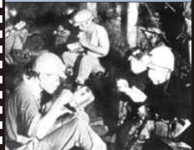
昭和 35 年ごろ 立川炭鉱 (昼食風景)