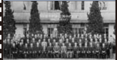
昭和 29 年 3 月 13 日 合併調印式