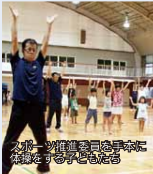
スポーツ推進委員を手本に 体操をする子どもたち

雨でもやりました！ ラジオ体操会 8月3日、国見台体育館でラジオ体操会がありました。これは、市スポーツ推進委員協議会が市民の体力づくりを目的に実施しているもので、この日は、前夜からの雨の影響で屋内開催となりましたが、参加者は夏の朝の心地よいひとときを過ごしました。