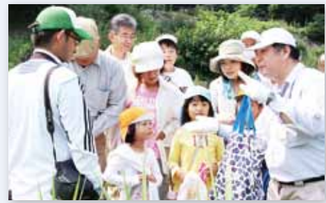
↑『伊万里のしぜん探検隊』で学芸員(右)の説明を熱心に聞く参加者

7月21日と8月10日に、『伊万里のしぜん探検隊』が夢みさき公園とカブトガニの館でありました。参加した家族連れは、夢みさき公園の広場や川辺などで夢中になって生き物を探し、見つけては歓声を上げていました。また、名前が分からないものや初めて見