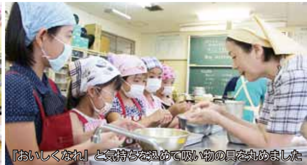
『おいしくなれ』と気持ちを込めて吸い物の具を丸めました