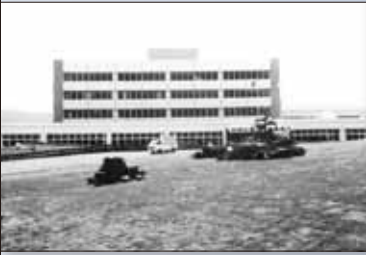
昭和 48 年 8 月 19 日 新市庁舎完成