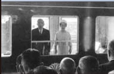
昭和 44 年 11 月 昭和天皇・皇 后両陛下、伊万里駅をご通過