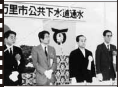
昭和 63 年 3 月 下水道管渠・浄化センター完成