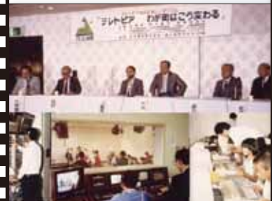
昭和 61 年 3 月 テレビピアモデル指定