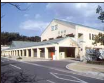
平成 7 年 7 月 市民図書館オープン