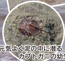
元気よく泥の中に潜るカブトガニの幼生