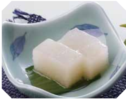
梨の食感と風味がすがすがしい