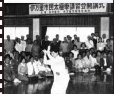
昭和 63 年 4 月 中国大連市からの太極拳指導