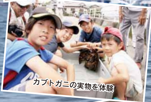
カブトガニの実物を体験