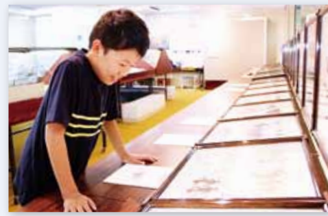
↑『昆虫展』は初めて見る珍しい昆虫がずらり

7月20日から8月31日にかけて、歴史民俗資料館で『佐賀と世界の昆虫展』がありました。これは、さまざまな昆虫を学ぶ機会を提供することで、子どもたちに身近な環境問題などについて考えてもら