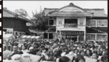
昭和 29 年 4 月 伊万里市役所開庁