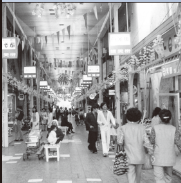
昭和 48 年 4 月 銀天街アーケード完成