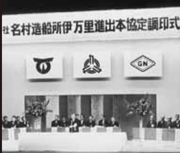
昭和 47 年 3 月 (株) 名村造船所進出