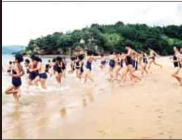
平成 3 年 7 月 イマリンビーチ オープン