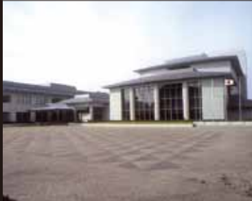
平成 4 年 10 月 市民センター落成