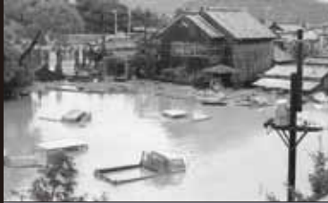
昭和 42 年 7 月 9 日 大水害