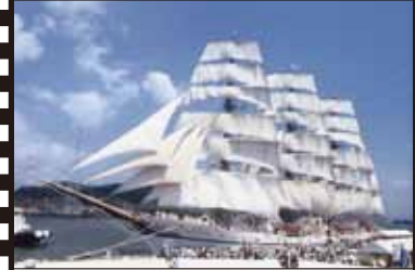
昭和 60 年 10 月 日本丸伊万里港寄港