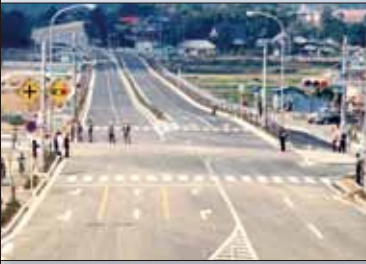
昭和 50 年 4 月 伊万里バイパス完成