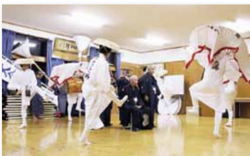
↑脇野の大念仏保存会による幻想的な舞い

信仰形態本来の白装束をま とつた6人の踊り手が円陣を 組み、一心不乱に踊る姿に、 集まった観客は熱心に見入っ ていました。