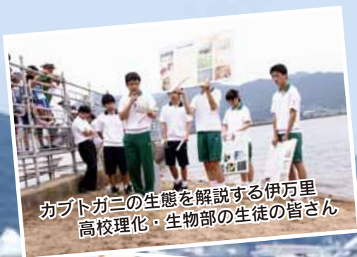
カブトガニの生態を解説する伊万里高校理化・生物部の生徒の皆さん