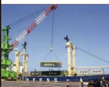
平成 9 年 4 月 韓国・釜山港との定期コンテナ航路開設