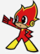
防火キャラクター キュートくん