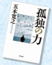
『孤独の力』 五木 寛之/著 東京書籍

近年、老人の孤独死や『おひとりさま』問題が話題になっていますが、人は孤独を恐れながらも、独りで生まれて、独りで死んでいくものなのです。80才を過ぎ、人生の総まとめ期にある著者が、親鸞や西行、キリストなどの生涯と自身の体験をベースに、『孤独を友とする生き方を『孤独の力』として教えてくれます。』