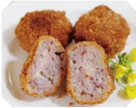
子どもも喜ぶ♪ ライスコロツケ 黒米ごはんとチーズの ボール揚げ