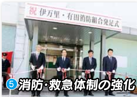
⑤ 消防・救急体制の強化

2014年もあとわずかです。あなたにとって、この1年はどのような年でしたか。私たちが住む伊万里市でも、たくさんの出来事や話題がありました。ここでは、2014年という年が、市にとってどのような1年だったのか、『広報伊万里』をもとに振り返ってみます。