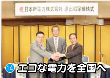
14 エコな電力を全国へ