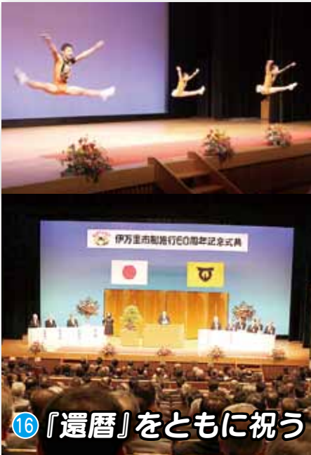
16 『還暦』をともに祝う