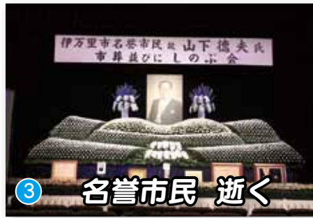
③ 名誉市民 逝く