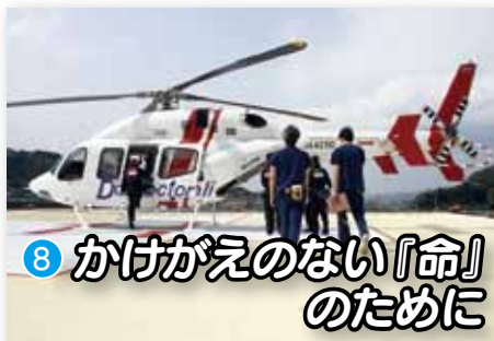
⑧ かけがえのない『命』 のために