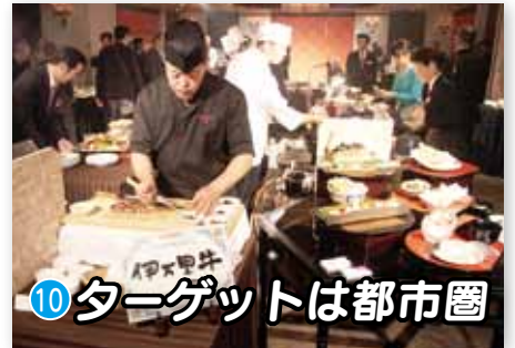
10 ターゲットは都市圏