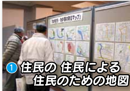
① 住民の 住民による 住民のための地図