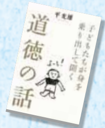
『子どもたちが身を乗り出して聞く道徳の話』 平 光雄/著 致知出版社

宿題はやらない、作業は乱雑、いろいろ口実をつけて行動しない、そんな子どもに対して、どうしてあげたらいいのでしょうか。教師歴32年の著者は、自作の紙芝居やイラストを使い、子どもたちに道徳の授業を行ってきました。教育現場での試行錯誤を経て、『子どもの心に伝わった』と自負する方法をたくさん教えてくれます。