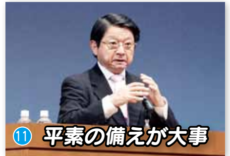
11 平素の備えが大事