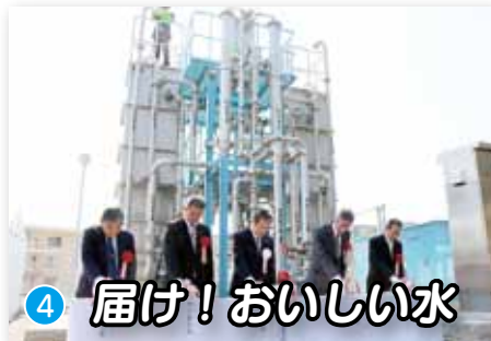
④ 届け! おいしい水