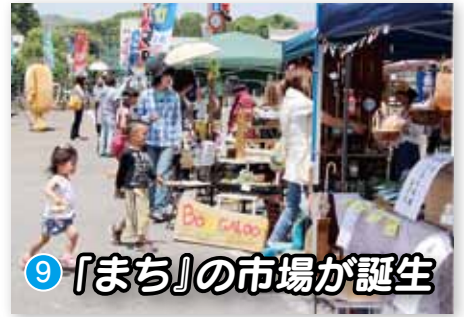
9 『まち』の市場が誕生