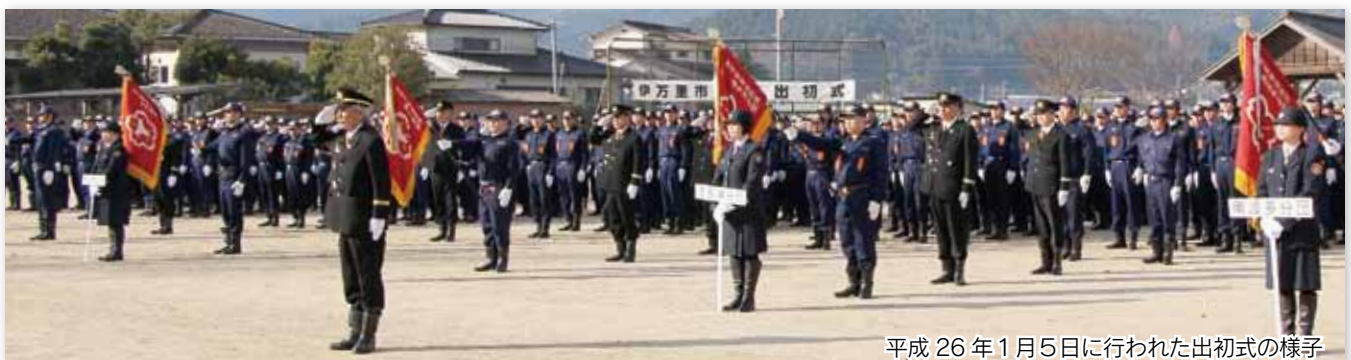
平成26年1月5日に行われた出初式の様子