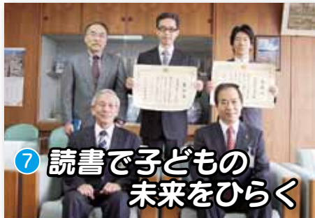
⑦ 読書で子どもの 未来をひらく