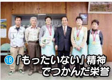
18 『もったいない』精神 でつんだ栄誉