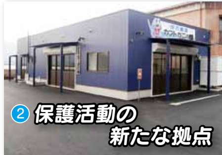
② 保護活動の 新たな拠点