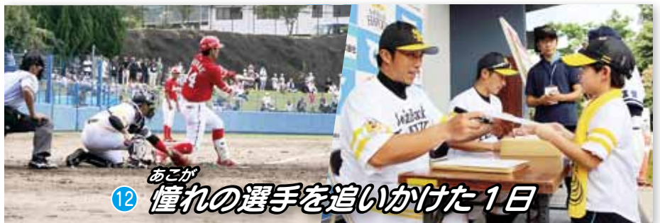
12 あこが 憧れの選手を追いかけた1日