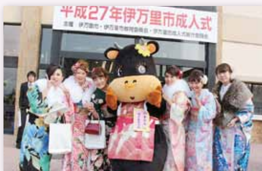
↑決意を新たに大人への一歩を踏み出した新成人

この日は、幼児から大人まで約60人が参加し、園児や児童たちは学年別に分かれて、絵札を囲んで正座。読み手の声を聞き漏らさないようじっと耳を澄まし、札を見つけると、「はい」と大きな声を出して取り合っていました。また、百人一首では、小・中学生と大人が参加し、2チームに分かれて熱戦が繰り広げられました。 この日使用されたかるたは、市内の名所などを題材に詠まれた『伊万里観光かるた』や、いろはかるたなど約20種類。参加者は、かるたや百人一首を使って遊びながら、交流を深めつつ、言葉の面白さや伝統文化の大切さなどに触れ、楽しく学んでいました。