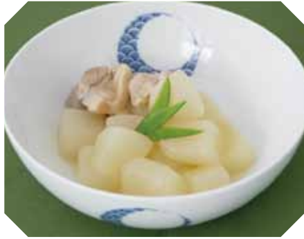
寒い時期に体が温まる1品 とうがん 冬瓜のあんかけ