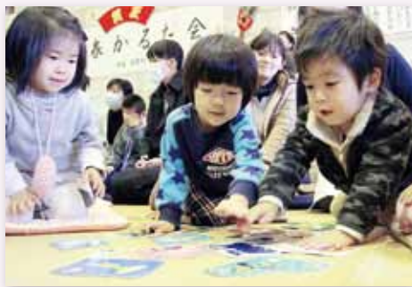
↑懸命に絵札を探す園児たち。「あっ、見つけた!」

1月18日、市民図書館で『新春かるた会』が開催されました。これは、昔ながらの遊びを通して、子どもたちに日本の伝統文化などを知ってもらおうと、『図書館フレンズいま』が毎年この時期に開催しているものです。