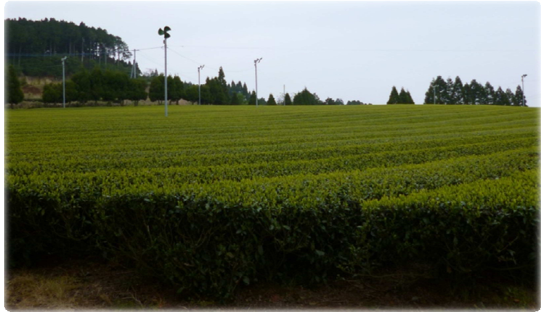
伊万里市 東山代町 日南郷