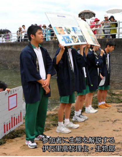
参加者に生態を解説する伊万里高校理化・生物部

多々良海岸で『カブトガニの産卵を観る会』が開催されました。これは、『生きている化石』と呼ばれるカブトガニの神秘的な産卵を観察しようと、市カブトガニを守る会などが毎年実施しているものです。市内外から多くの観客が訪れ、伊万里高校の理化・生物部による生態説明を受けたあと、砂浜で産卵するカブトガニを観察。また、この日は市内2小学校の児童や保護者などが、自校で育てたカブトガニの幼生（約1,200匹）を放流しました。