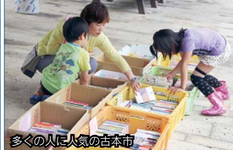
多くの人に人気の古本市