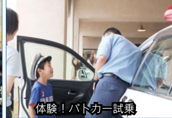
体験! パトカー試乗