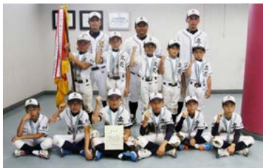
↑優勝した立花少年野球の選手たち

● 期 日 6月20日(土)・21日(日)・27日(土)、7月4日(日) ● 場 所 国見台野球場