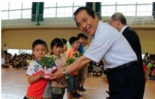
↑塚部芳和市長（右）などから花苗を受け取る児童

この苗は、児童たちによって大切に植え替えや管理が行われ、花が咲く10月には観賞会が開催される予定です。