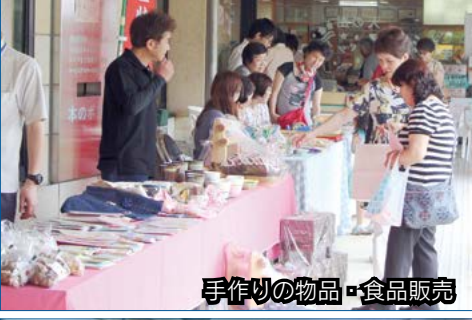
手作りの物品・食品販売