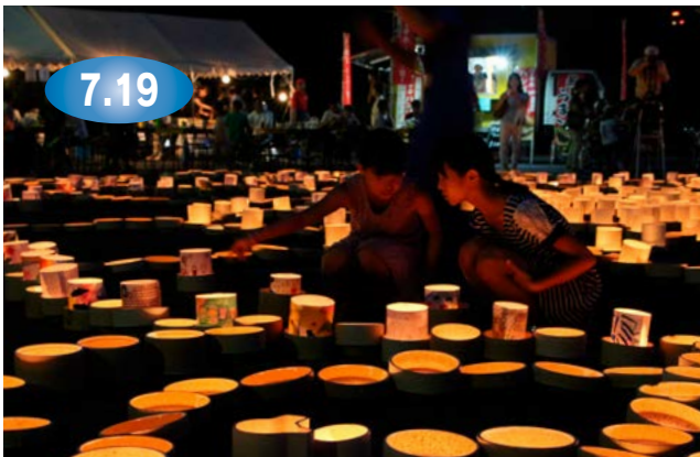
↑ボシ灯ろうの柔らかな光を見つめる子どもたち

風鈴まつり開催中の大川内山で、ボシ灯ろうまつりが開催されました。伊万里鍋島焼会館前特設ステージから碗琴の透き通った涼しげな音色が響く中、同会館前広場などに設置された約3,000個のボシに点灯。辺りが暗くなると、会場は幻想的な光の空間に変わり、市内外から訪れた多くの来場者は、一夜限りの夏の夜の音と光を楽しみました。