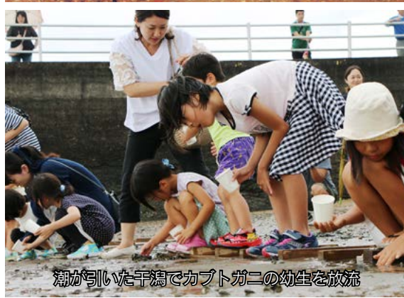
潮が引いた干潟でカブトガニの幼生を放流