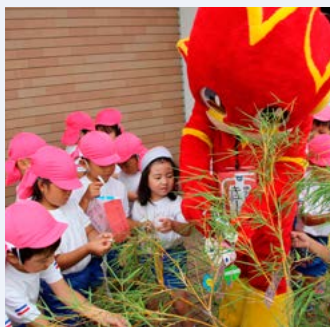
↑キュートくん(右)もお手伝い

園児52人が参加し、消防署の署員やマスコットキャラクター「キュートくん」と一緒に、防火への思いや願いごとを書いた色とりどりの短冊を2本の竹に飾り付けました。七夕の歌を元気に合唱した後、署員から「花火や水遊びは必ず家の人と一緒にしましょう」と呼びかけると、「はい」と大きな声で返事をしていました。