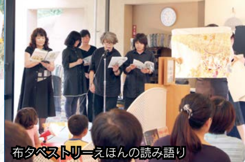
布タペストリーえほんの読み語り