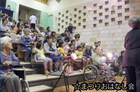
☆まつりおはなし会