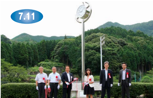
↑大川内山の新たなシンボルとして親んでもらうことを期待