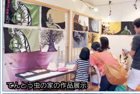
てんとう虫の家の作品展示