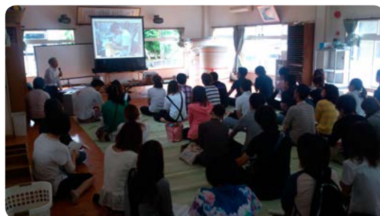
↑多くの人が人権・同和問題について学んでいます

幸せな家庭や社会を築く第一歩として、あなた自身の人権意識を高めるための学習に取り組んでみませんか。市では、研修講座を企画する地域や団体、企業などに対して、社会教育指導員を講師として派遣しています。研修講座の開催を希望する団体などの皆さんは、気軽に申し込んでください。