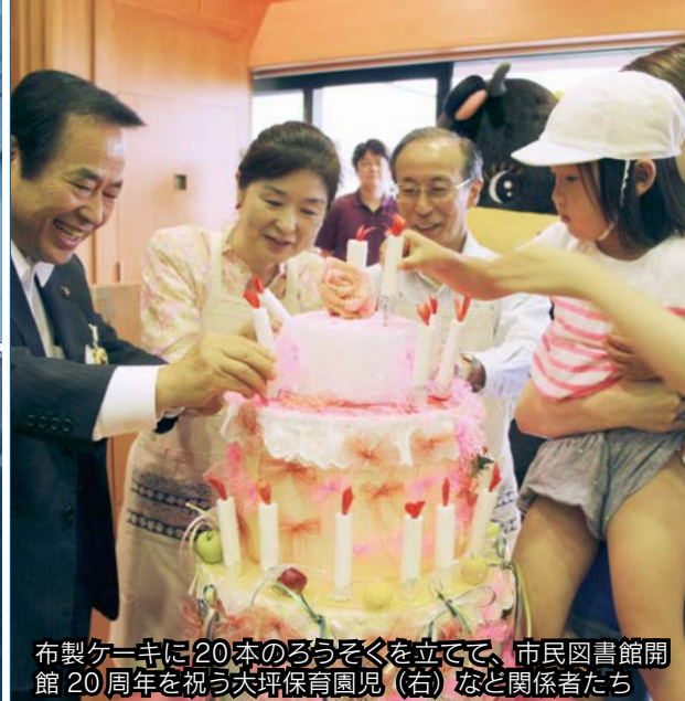
布製ケーキに20本のろうそくを立てて、市民図書館開館20周年を祝う大坪保育園児(右)など関係者たち