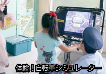
体験!! 自転車シミュレーター