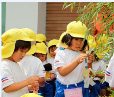
↑「お願い」を短冊に書いて飾り付け

これは、花火を楽しむ機会が増え始める七夕の時期にあわせ、幼少期の防火意識を向上させることを目的に、毎年行われているものです。