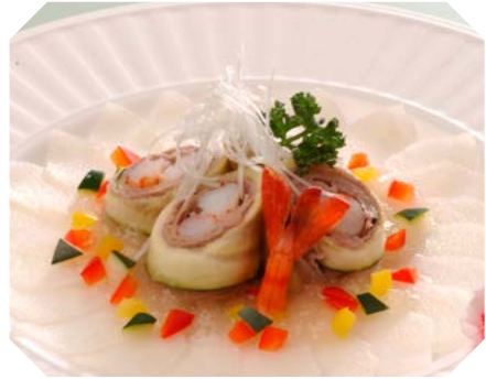
旬の梨を和風ソースにアレンジ