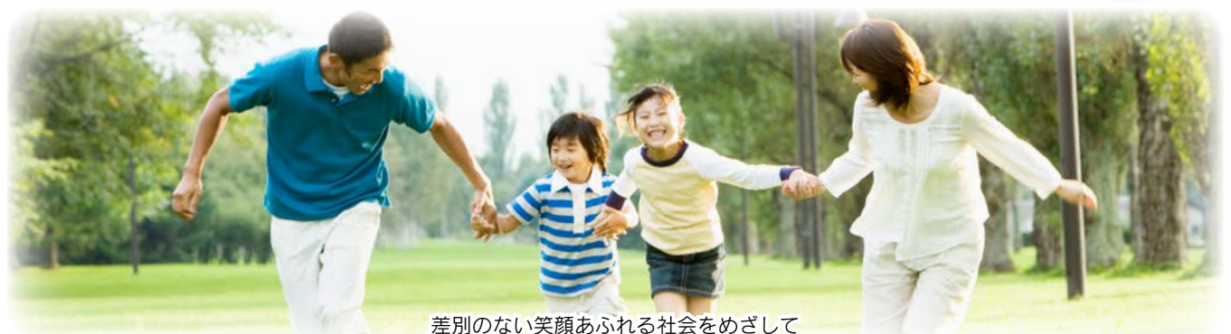
差別のない笑顔あふれる社会をめざして

解が定着していないと、日常生活を通じて偏見などのマイナス情報が心の中に刷り込まれてしまい、周囲の差別的な言動を見過ごしたり同調したりしてしまう可能性もあります。また、自分の何気ない一言が、相手を傷つけ悲しませてしまう場合もあります。「自分とは関係ない」と他人事にして捉え、きちんと向き合うことが大切です。 同和問題を解決するためには、市民の皆さんがきちんと学ぶことによって正しく理解し、正しく行動していくことが重要です。差別の無い明るい社会の実現をめざし、私たち一人一人が取り組みましょう。