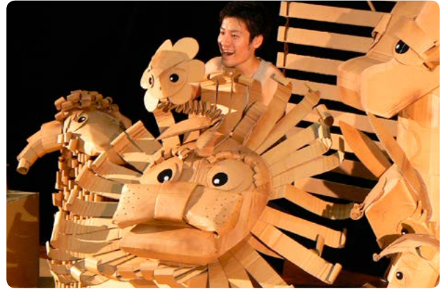
↑誰もが夢になれる「平常」が演じるダイナミックな舞台

段ボールで作った創造性あふれる人形たちが登場します。主人公の『お花のハナツク』が、さまざまな動物たちとの出会いを通じて、自分にしかない個性や魅力を再発見していく、希望と感動がいっぱい詰まった人形劇です。