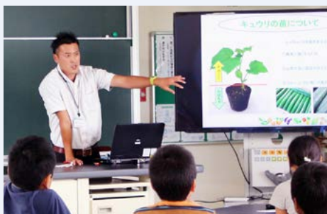
↑二里小4年1組の授業で、きゅうりやアスパラガスの栽培方法などを紹介するJA職員

市内の学校などで、地元農産物に関する食育学習と、学校給食への地元産食材の提供が行われました。これは、地産地消への理解を深めながら、子どもたちに食について考える習慣を身に付けてもらおうと実施されたものです。