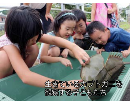
生きているカブトガニを観察する子どもたち