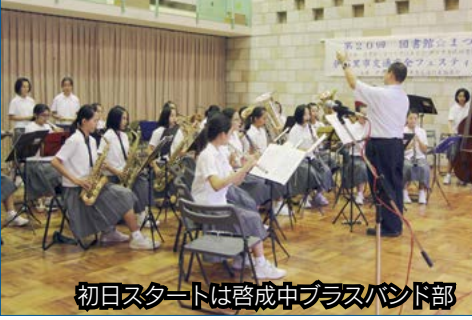
初日スタートは啓成中 brassバンド部