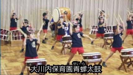
大川内保育園青螺太鼓