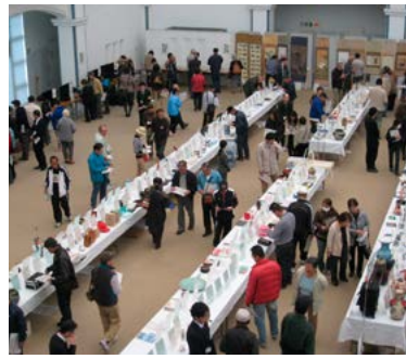
平成24年に開催された合同公売会

日用品から高額物品まで、多数出品される予定です。皆さん、気軽に参加してください。