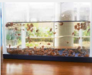
↑学校の水槽で大切に守り育てられるカブトガニの幼生

これまで、伊万里のカブトガニはさまざまなかたちで保護されてきました。国の天然記念物指定の答申をきっかけに、これからは保護活動を一層充実させていくことが求められます。