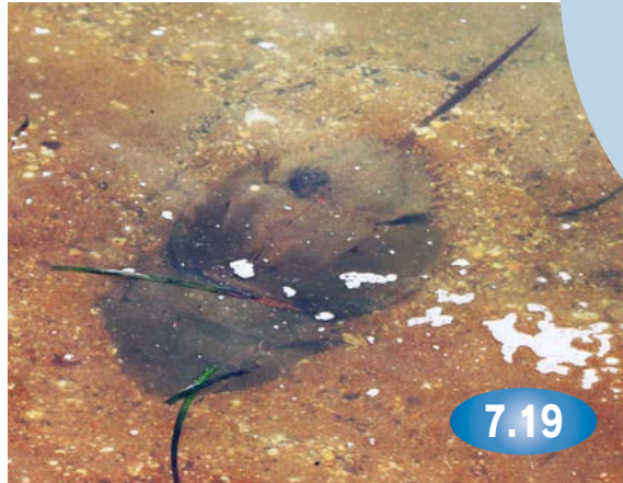
↓多々良南海岸で産卵するカブトガニ