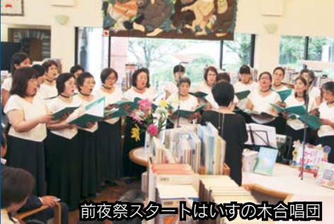
前夜祭スタートはいすの木合唱団

7月3日(前夜祭)と4・5日、『支えあい はぐく 育みあって20年』をテーマに、開館20周年を祝う図書館☆まつりが開催されました。これは、平成7年7月7日に市民図書館が開館したことを市民の皆さんと一緒に祝い、一人でも多くの人が図書館に集うことをめざして、市民団体でつくる実行委員会が開催したものです。 前夜祭は図書館専属のいすの木合唱団の歌声で、翌日は啓成中学校 brassバンド部の演奏でスタート。コーラスや人形劇、おはなし会、俳句まつり受賞作品・団体活動の展示のほか、物品・食物販売、古本市、交通安全フェスティバルなど多彩な催しが行われ、多くの市民でにぎわいました。