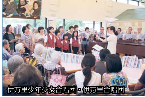
伊万里少年少女合唱団・伊万里合唱団