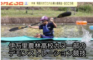
伊万里農林高校カヌー一部のデモンストレーション競技

● 問合せ先 二里公民館内 有田川カワニバル実行委員会事務局 (☎☎23024)