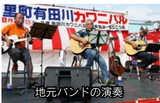
地元バンドの演奏