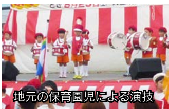
地元の保育園児による演技