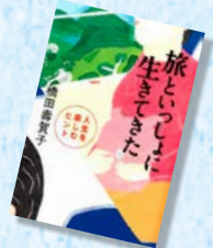
「旅といっしょに生きてきた」 橋田 壽賀子/著 祥伝社

若い頃、ユースホステルを利用して、多いときは1年で200日を旅するなど、筋金入りの旅好きの著者。日本中はもちろん、海外に出かけては、ヘリコプターに乗れるツアーで、上空から北極点や活火山を眺めたことも。ふだんとは違う目線で景色を楽しむなど、好奇心旺盛で元気な姿がうつられています。