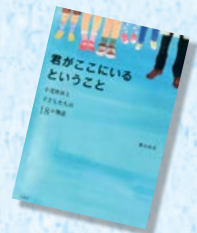
「君がここにいるということ」 緒方高司/著 草思社

25年間、小児科医として現場で奮闘してきた著者が出会った子どもたちとの物語が収められています。子どもの病気と向き合い、子どもや親の心に寄り添った治療の様子からは、彼が本当に小児科医という仕事を好きだということが感じられます。あらためて命の尊さを考えさせられる1冊です。