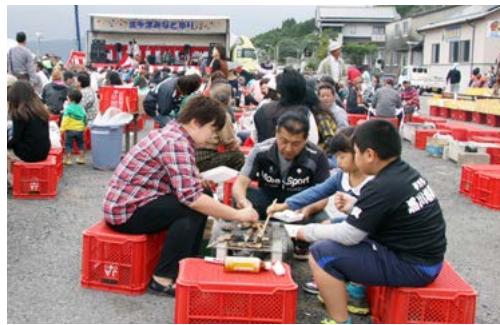
↑大勢の来場者でにぎわう昨年の波多津みなと祭り

● 問合せ先 波多津公民館内 波多津みなと祭り実行委員会事務局 (☎☎☎0001)