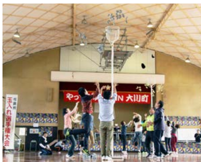
↑ 昨年の佐賀県玉入れ選手権の様子

※応募多数の場合は、書類選考(応募者の年齢や居住地、市内交通機関の利用状況などを考慮)