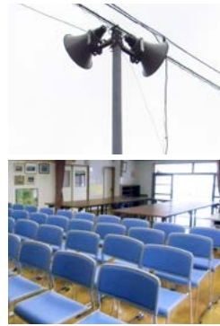
→更新された屋外放送設備（上）と購入された机・椅子（下）

宝くじ助成金を活用して山代町鳴石区が整備を進めていた屋外放送設備の更新と自治公民館の机・椅子の購入が、9月末に完了しました。これにより、災害発生時や緊急時にお