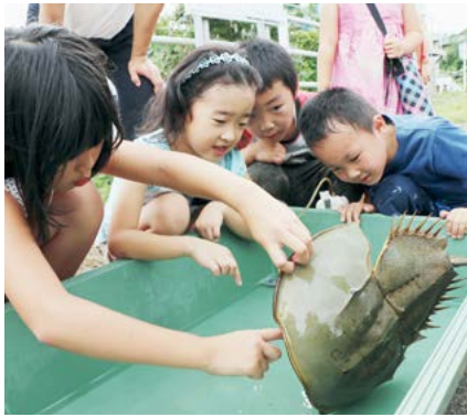
↑ 7月19日、『産卵を観る会』で、生きて いるカブトガニと触れ合う子どもたち

保存にあたっては、これまで実施してきたカブトガニに関する調査や研究について、大学などの研究機関との連携も視野に入れながら、発展的に継続していくことにしています。