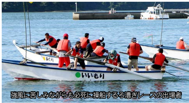
強風に苦しみながらも必死に操船するろ漕ぎレースの出場者