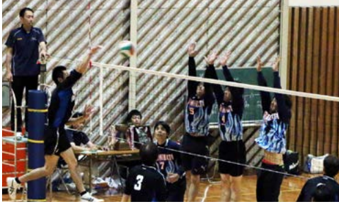
↑国見台体育館で行われた男子の試合(決勝戦)の様子