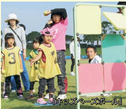
『キッズベースボール』