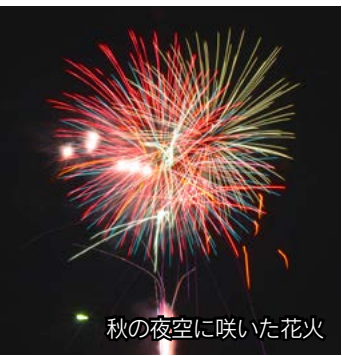
秋の夜空に咲いた花火

地元手作りのイベントで地域を活性化しようと、波多津漁港で『波多津みなと祭り』が開かれました。この日、県内外から約 3,500 人が訪れ、海・山の幸バーベキューや農水産物販売のコーナーを満喫。海上では、ろ漕ぎレースやクルージングも催されるなど、終始、会場は大盛況となりました。また、辺りが闇に包まれると、祭りのフィナーレを飾る花火が夜空を華麗に彩り、来場者はぜいたくな秋のひとときを心ゆくまで楽しんでいました。