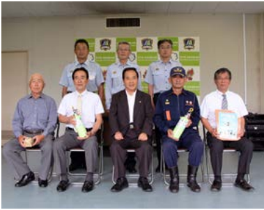
↑住宅用火災警報器などの交付を受けた松浦町区長会の皆さん