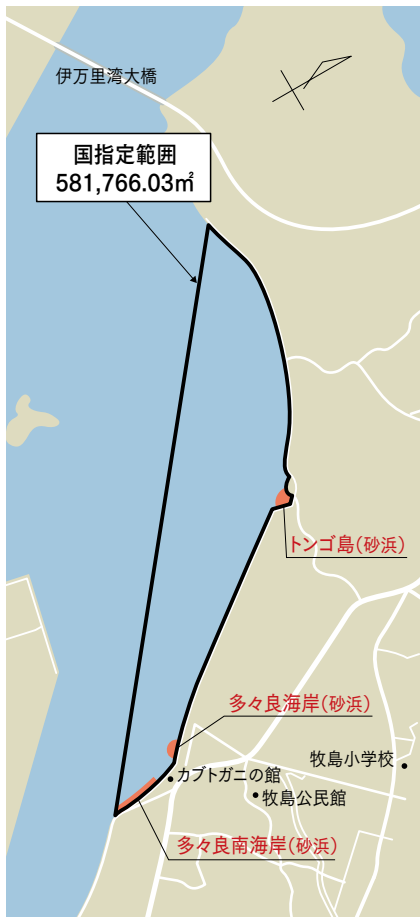
【図】天然記念物の指定範囲

はるか2億年前から姿を変えていないカブトガニ。 伊万里湾の繁殖地は、地理的要因や保護活動、将来性を評価され、 今回、国の文化財として天然記念物に指定されました。 まずは、指定の対象地域や理由などを確認します。