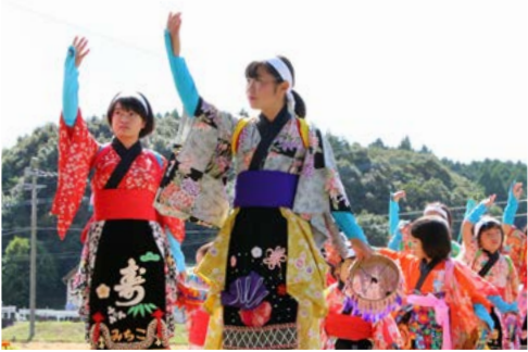
↑華やかな衣装を身にまとい、踊りながら愛宕神社まで『道行き』する子どもたち

府招の浮立は、昭和43年に県重要無形民俗文化財に指定され、昭和62年に記録措置を講ずべき無形民俗文化財として選択されています。