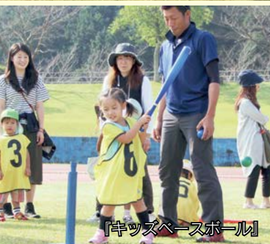
『キッズベースボール』