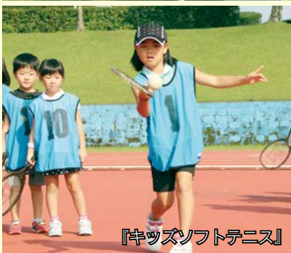
『キッズソフトテニス』