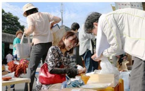
↑リサイクルフェアで、所狭しと並ぶ物品の中からお目当ての品を買い求める来場者