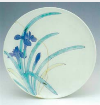
『色絵杜若文三足付皿』

写真(下)の作品は、1670年〜1680年代に作られたものです。皿の口径は27・7センチメートルで、文様の杜若の葉が伸びやかに描かれているのが