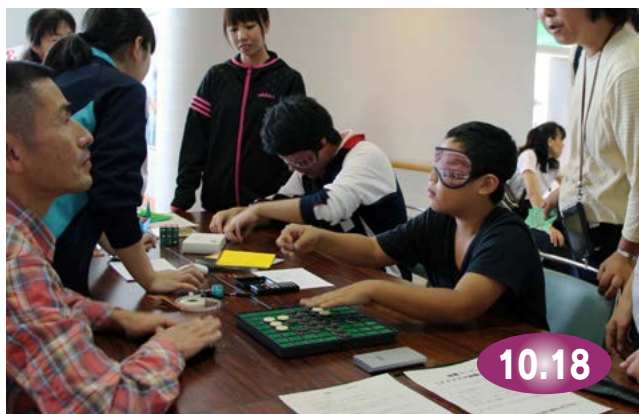
↑ アイマスクをして目が見えないことの大変さを実感する参加者

市民センターで、ボランティアまつりが開催されました。これは、市民との交流を通じてボランティア活動を啓発・推進しようと、市ボランティア連絡協議会などが毎年この時期に開催しているものです。踊りやバンド演奏などのステージ発表のほか、会場内には多彩な催しや展示・体験コーナーなどが設けられ、家族連れなどでにぎわっていました。