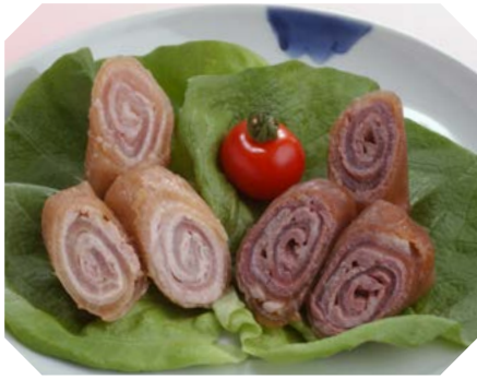
子どももおいしく食べられる大根のおかず