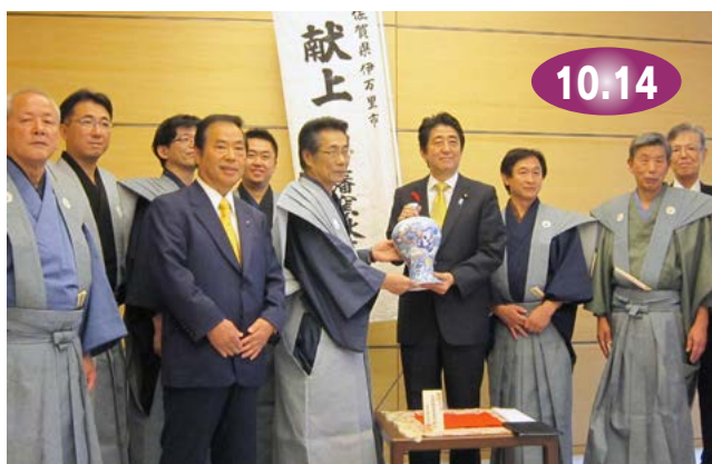
↑ 安倍首相に瓶子を献上した伊万里鍋島焼協同組合の皆さん

伊万里鍋島焼協同組合による『献上の儀』が首相官邸で行われ、酒器『色絵鍋島文様尽し瓶子』が安倍晋三首相に献上されました。これは、『鍋島』を将軍家などへ献上していた先人の偉業に感謝し、伝統技法を継承していくため、平成元年から城がある自治体の長などに贈っているもので、今回有田焼創業 400 年を前に、初めて首相に贈られたものです。