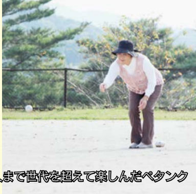
子どもから大人まで世代を超えて楽しんだペタンク