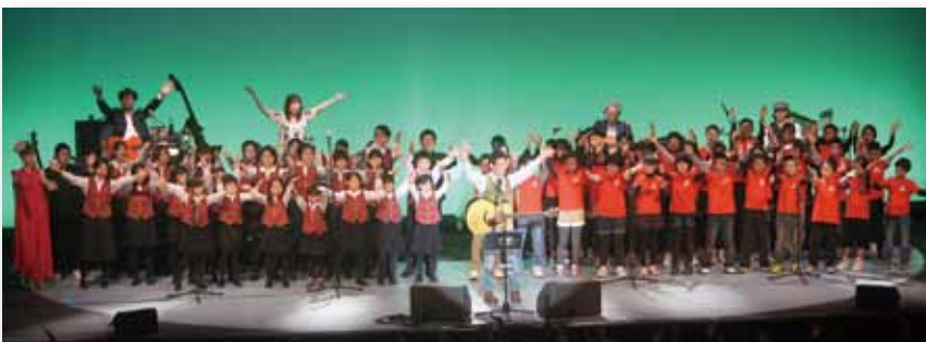
↑『愛よ急げ』を合唱する伊万里少年少女合唱団と波多津小学校の子どもたち