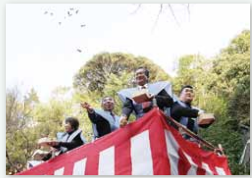
↑各年代の巳年生まれが盛大に豆まき

この日、波多津東幼稚園、波多津保育園、黒川幼稚園、たんぼ保育園には北分署の消防士が扮した『火遊び鬼』が出没。迫力満点の赤鬼の登場に、思わず先生にしがみついたり泣いたりする園児もいましたが、防火キャラクター『キュートくん』が登場すると勇氣百倍。みんなで火の用心を呼びかけながら豆に見立てた新聞紙を投げて鬼をこらしめました。豆まきが終わると、心を入れ替えた鬼と園児たちはすっかり仲良し。記念撮影をするなど