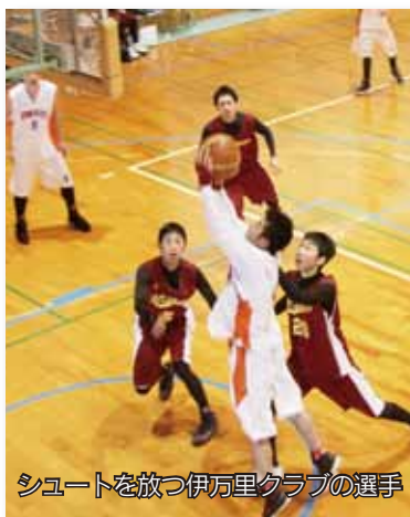
シュートを放つ伊万里クラブの選手