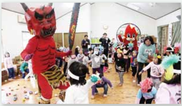
↑火遊び鬼を退治するたんぼ保育園の園児たち

2月1日、市内の保育園や幼稚園7か所で、消防士による防火の講話と豆まきがありました。これは、市消防本部北分署と東分署が、園児の今年一年の無病息災を祈り、幼年期に防火意識を高めて欲しいとの願いを込めて毎年行っているものです。