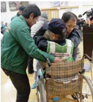
→ 佐賀県防災士の指導を受けながら要援護者役の男性を車いすに乗せる住民

避難場所となった大川公民館では、県防災士の指導による要援護者の介助訓練をはじめ、放射線測定器による測定訓練や放射線についての講話、炊き出しなどが行われました。参加者は、避難の手順や要援護者の支援方法、避難