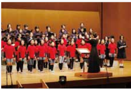
↑第10回の開催を記念してOGや保護者と一緒に合唱する伊小コーラス部の皆さん

この日は10回目の開催を記念し、琴の演奏を交えて童歌や劇を織り交ぜた『100万回生きたねこ』の合唱組曲のほか、同部出身の中学生や保護者と一緒に合唱を行うなど、その美しい歌声で会場を魅了していました。