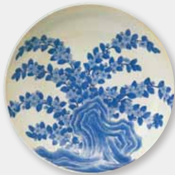
↑伊万里市重要文化財『染付岩山吹文皿』

大川内山鍋島藩窯跡（以下、藩窯跡）は、17世紀後半から明治4年まで鍋島焼を焼いていた窯跡です。藩窯跡は、大川内山集落内の標高約115㍎から約138㍎の丘陵上に位置しています。 藩窯跡は、全長137㍎で、斜面地に焼き物を焼くための部屋（焼成室）を27室から30室連ねた、大規模な連房式登窯という構造でした。 登窯は、中央付近の焼成室が焼き物への火の当たり加減がよく、良い製品がで