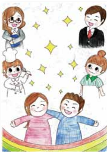
男女協働参画基本計画表紙 イラストコンテスト最優秀賞 吉富千華子さん(有田工高2年)