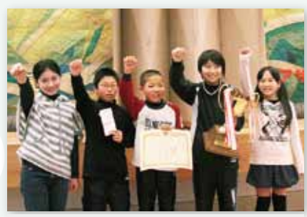
↑見事に優勝を果たし、笑顔がはじける伊万里小学校の児童たち