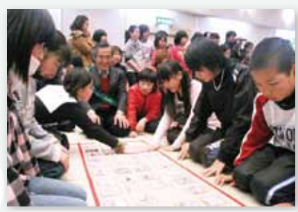
↑判定はどっち!?思わず息をのむ白熱した取り合いが展開しました