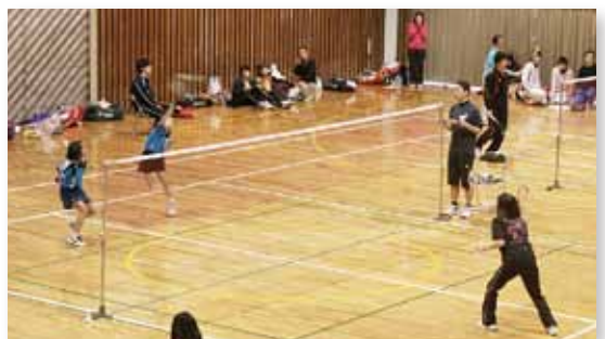
↑ジュニア選手たちも一般の選手を相手に奮闘