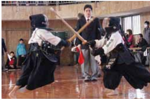
↑思わず息を呑むような緊迫した試合が多く展開

第43回伊万里市スポーツ少年団剣道交流大会が2月3日、国見台武道館でありました。大会は、市内の13道場から選手約100人が出場し、団体戦と個人戦で白熱した戦いを繰り広げました。