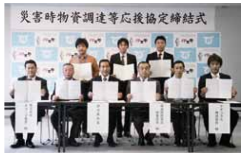
↑ 調印した協定書を手に記念撮影をする事業者など