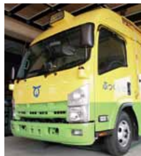
↑自動車図書館ぶつくん1号