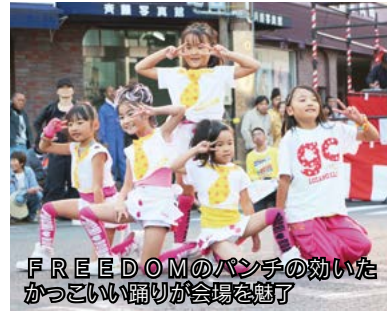
FREEDOMのパンチの効いたカッコいい踊りが会場を魅了