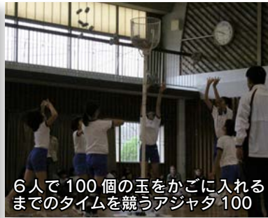
6人で100個の玉をかごに入れるまでのタイムを競うアジャタ100