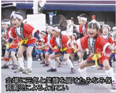
会場に元気と笑顔を届けたみなみ保育園児によるよさこい