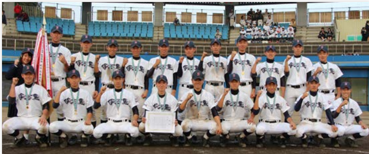
↑先制し効果的に追加点を奪う展開で決勝戦をものにした伊万里高校野球部