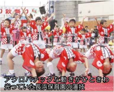
アクロバチックな動きがひとときを驚かせていた長浜保育園の演技