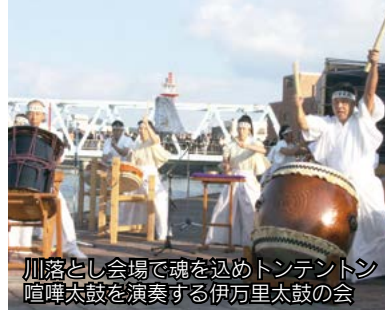
川落とし会場で魂を込めトントンン 喧嘩太鼓を演奏する伊万里太鼓の会