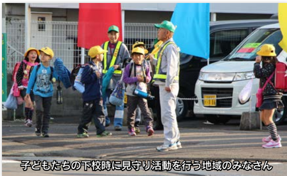
子どもたちの下校時に見守り活動を行う地域のみなさん

さつ運動や美化活動、110番の家の設置や防犯マップの作成、防犯パトロールの実施など、地域ぐるみでの活動も行われています。さらに、防犯協会では、各種団体との連携を行いながら、小学校新一年生への防犯ブザーの贈呈や防犯カメラの設置費用の補助などが行われています。