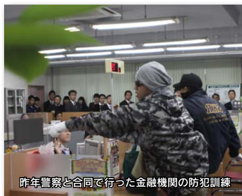
昨年警察と合同で行った金融機関の防犯訓練

これから年末に向け、特に夜間、深夜は犯罪が起こりやすくなりますので、今後とも常に防犯を意識した体制や店舗づくりを進めていきたいと思っています。