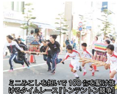
ミニみこしを担いで100歩を駆け抜けるタイムレース『トントンン競争』