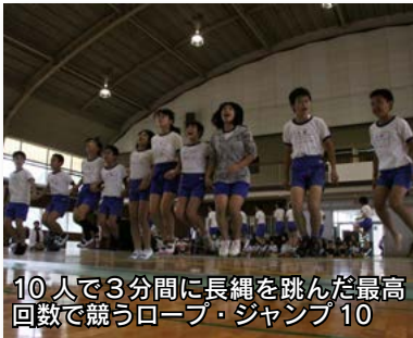
10人で3分間に長縄を跳んだ最高回数で競うロープ・ジャンプ10