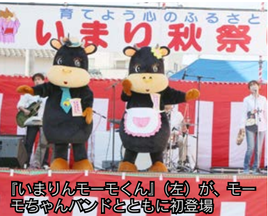
『いまりんモーモくん』(左)が、モーモちゃんバンドとともに初登場