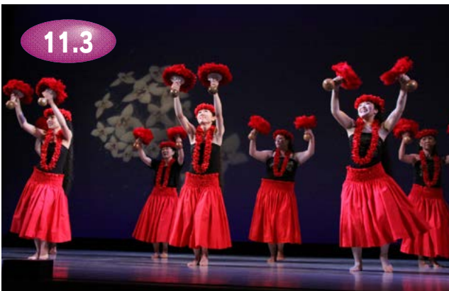
↑YKハワイアンフラサークルの小気味よいフラダンスが会場を魅了