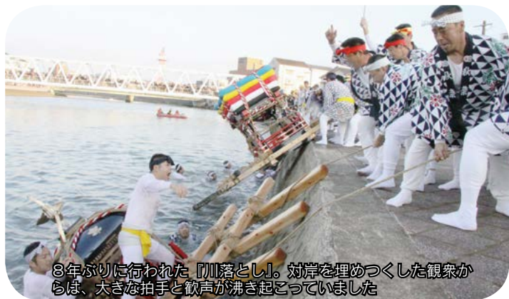
8年ぶりに行われた『川落とし』。対岸を埋めつくした観客からは、大きな拍手と歓声が沸き起こっていました

また、伊万里神社御幸祭『伊万里トントンン祭り』では、27日に8年ぶりとなる『川落とし合戦』が行われました。