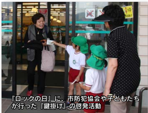
「ロックの日」に、市防犯協会や子どもたちが行った「鍵掛け」の啓発活動