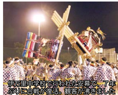
伊万里中学校で行われた安曇で、7年ぶりに合戦が復活。観客が沸きました