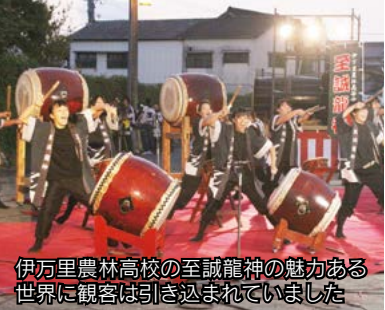
伊万里農林高校の至誠龍神の魅力ある世界に観客は引き込まれていました