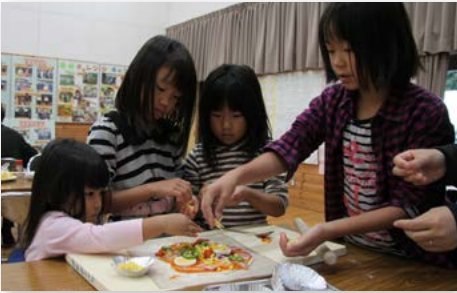
↑おいしいピザになあ〜れ！4人で仲良く具材をトッピング

11月3日、東山代町川内野の夢耕房たきでは、『秋の収穫祭・夢の市』がありました。地元自慢の石窯で焼く人気の親子ピザづくりが行われたほか、特産の黒米を使ったうどんが食べられる食事コーナーなどが設けられました。 来場者は、風光明媚な山あいの自然に触れながら地元のアイデアがいっぱいに詰まった取り組みを満喫しました。