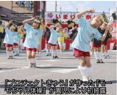
『プロジェクトきょう』が作った『モーモちゃん体操』が園児により初披露