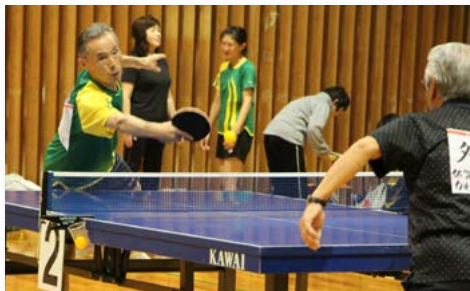
↑県内各地から33チーム160人が参加し、レベルの高い熱戦が繰り広げられました