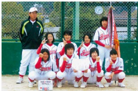
↑堅い守りで相手に得点を与えず大会を勝ち抜いた伊万里中学校ソフトボール

第1回秘窯の里伊万里 ラージボール卓球大会 期 日 11月3日(日・祝) 場 所 国見台体育館