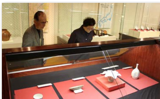
↑初公開の市民の秘蔵品を一つ一つ熱心に見る来場者

で、市民17人から秘蔵のやきもの42件50点の提供がありました。江戸時代初期に作成された壺や鍋島家の家紋が入った酒瓶など、ほとんどが初公開のもので、来場者は、普段は見ることのできない貴重な市民のお宝に熱心に見入っていました。