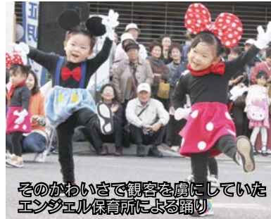
そのかわいさで観客を虜にしていたエンジェル保育園による踊り