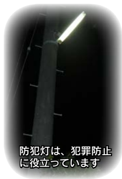
防犯灯は、犯罪防止に役立っています

防 犯に関する各種団体と連携による啓発活動を実施、推進するとともに、市独自では、夜間の事故や犯罪の未然防止を図り、安全を確保するため、各行政区における防犯灯の設置について、その費用の一部を補助しています。皆さんの周りに気になる暗がりがあり、防犯灯を設置したほうが良いと思われる場合は、その設置について区長さんへ相談してください。