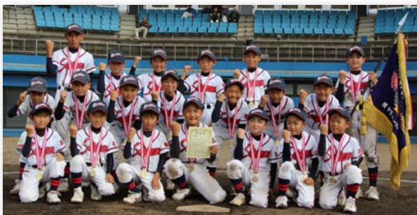
↑延長戦までもつれた激闘の決勝戦を制した大坪赤門少年野球