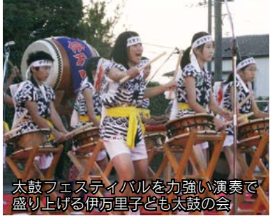
太鼓フェスティバルを力強い演奏で盛り上げる伊万里子ども太鼓の会