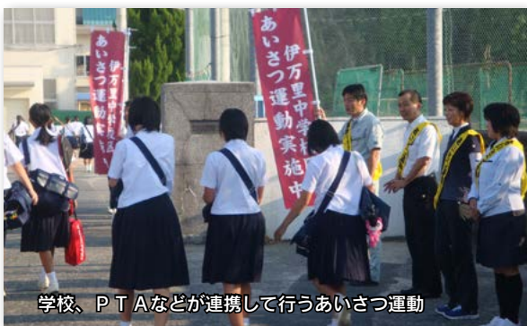
学校、PTAなどが連携して行うあいさつ運動