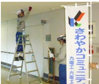
↑蛍光灯をきれいに掃除する(株)九電工の社員

10月22日、(株)九電工伊万里営業所が市民センターで奉仕作業を行いました。これは同社が公共施設の電気の清掃などを、毎年ボランティアで行っているもので、この日は社員17人が、市民センター内外の電灯器具の清掃と管球替えを行いました。