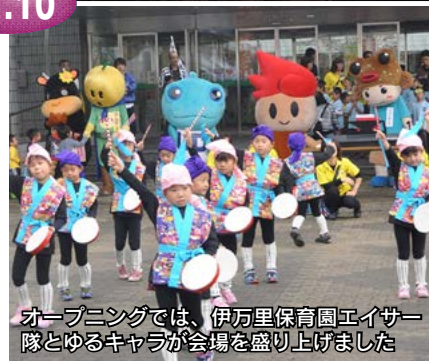
オープニングでは、伊万里保育園エイサー隊とゆるキャラが会場を盛り上げました