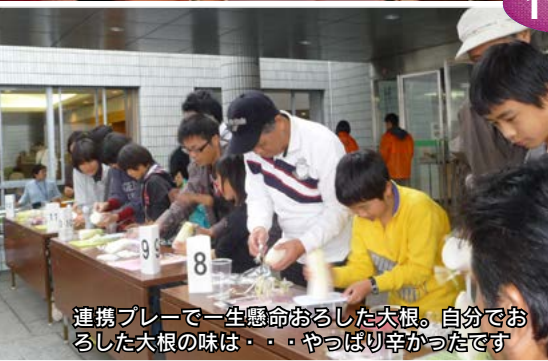
連携プレーで一生懸命おろした大根。自分でおろした大根の味は・・・やっぱり辛かったです