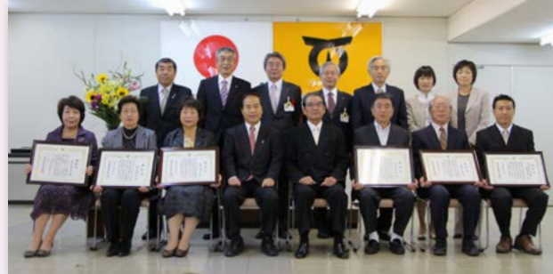
↑市教育委員会の表彰を受けた受賞者の皆さん

第31回全国高等学校弓道選抜大会団体競技女子の部で全国優勝の成績を収め、本市の名声を高めるとともに社会体育の振興に大きく貢献