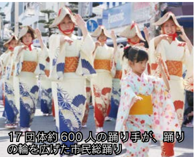
17回体約600人の踊り手が、踊りの輪を広げた市民総踊り