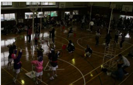
↑各チームのコスチュームでも、観客の目を楽しませていた玉入れ選手権

1チーム6人で、高さ4m、直径44cmのかごに玉100個をいかに早く入れられるかを競う目玉競技の『第11回佐賀県玉入れ選手権』では、県内外の35チームが賞金15万円をかけて激しい戦いを繰り広げていました。