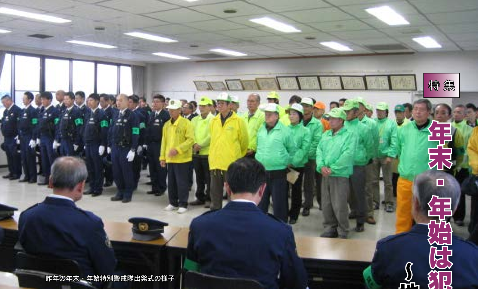
昨年の年末・年始特別警戒隊出発の様子

これから年末の慌ただしい時期から年始にかけては人の動きが多くなり、全国的に金融機関やコンビニエンスストア、深夜営業の飲食店などを狙った強盗のほか、自動車や自転車などの盗難、また、振り込め詐欺などの犯罪が増加する傾向にあります。 市においても例外ではなく、これからの時期は例年犯罪が増え、また、全犯罪発生件数でも、平成22年から24年まではやや減少したものの、今年は増加傾向にあり、自転車やオートバイなどの盗難、車上ねらいや空き巣ねらい、万引きや振り込め詐欺などが、私たちの生活の身近なところで起こり続けています。 どうしたらこれらの犯罪をなくし、安心して暮らせる社会をつくることができるのでしょうか。今回は、市における犯罪の発生状況と特徴を把握し、さらに地域や事業所などの取り組みを紹介しながら、一人ひとりがどのように防犯対策に取り組んでいけばよいのか考えます。