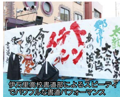
伊万里高校書道部によるスピーティでパワフルな書道パフォーマンス