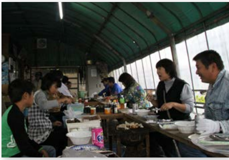
↑炭火焼きで味わうカキは格別のおいしさ！

11月3日、波多津ふれあい広場に恒例のカキ焼きがオープンしました。これは、地元の人たちが地域資源を生かしたまちづくりの一環として出店しているものです。この日は、初日ということで、カキ飯の販売やキノシロのみそ汁の振る舞い、自然薯など波多津産農産物の販売もありました。 来場者は、港や海をバックに磯の香りを感じながら、栄養豊富な海で育った旬のカキや伊万里牛などのバーベキューを堪能していました。