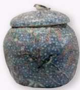
昨年の鍋島大賞の作品 『初雪』