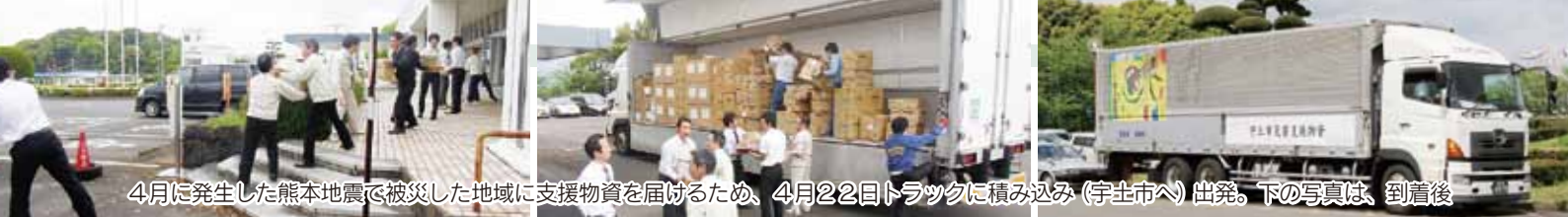
4月に発生した熊本地震で被災した地域に支援物資を届けるため、4月22日トラックに積み込み(宇土市へ)出発。下の写真は、到着後