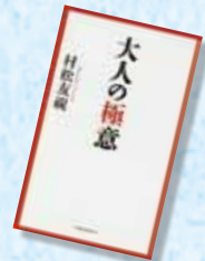
『大人の極意』 松村 友視/著 河出書房新社

あなたは理想の大人像を持っていますか。単純に大人といえば、成人した人。幾つになっても周りが好かれる人や頼りにされる存在になりたいものです。この本は、著者が出会ってきた『大人』について語っています。大人の振る舞いや言葉の選び方などを参考に、あなたも理想の大人像をめざしてみませんか。