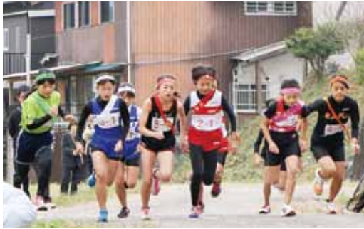
↑ 昨年の東京眉山山会旗ジュニア駅伝大会の様子