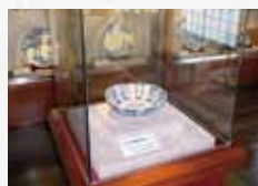
伊万里市陶器商家資料館「展示コーナー」

4 伊万里市陶器商家資料館「丸駒」 白壁土蔵づくりの建物を復元整備した資料館。江戸時代に活躍した陶器商人の暮らしをのぞいてみませんか? 営業時間 10:00~17:00 入場料 無料 定休日 毎週月曜日(祝日は翌日振替)、年末年始 ☎0955-22-7934