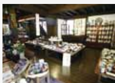
海のシルクロード館1階販売コーナー