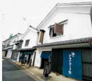
左:伊万里市陶器商家資料館 右:海のシルクロード館

3 海のシルクロード館 古伊万里の歴史や文化を体験できる施設としてオープン。2階には古伊万里を展示した古伊万里ギャラリー、1階には口クロ、絵付けの体験工房と肥前一帯の焼物販売コーナーがあり、お土産の購入に最適です。 営業時間 9:30~17:00 入場料 無料 定休日 毎週月曜日(祝日は翌日振替)、年末年始 ☎0955-23-1189