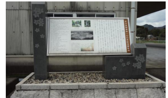
伊万里梨発祥の碑

井手口川ダム 洪水調整・水道水の安定 化・確保・河川の環境保 全を目的に建設。 総貯水容量 218 万 3 m