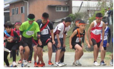
ジュニア駅伝の様子

イベントのフィナーレを飾り、九州一の秋花火と銘打って、尺玉を含む花火で締めくくります。どうか皆さま、お越しください!