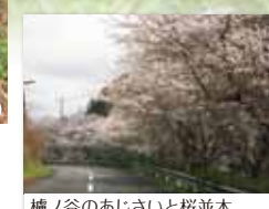
櫛ノ谷のあじさいと桜並木