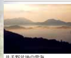
井手野盆地の雲海