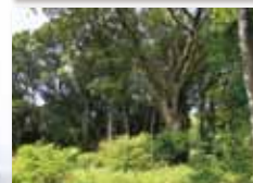
大野神社の自然林