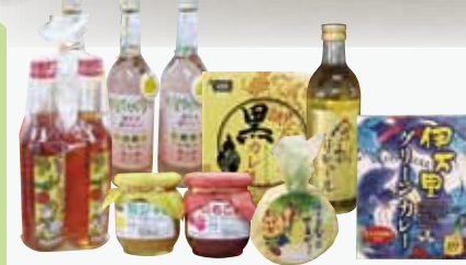
梨入りドレッシング