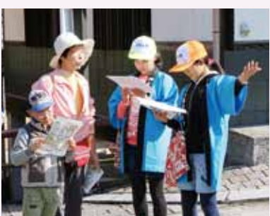
↑観光客に大川内山の観光名所の説明をする子ども観光ガイド(右2人)

11月3日・5日、大川内山で『子ども観光ガイド』の実践がありました。まちづくりの担い手育成を目的とした取り組みで、児童8人が7月から10月まで事前学習を行った上での披露。観光客に大川内山の魅力を伝えました。はじめは緊張で小声だったガイドも、だんだん声が出るようになり、分かりやすく説明していました。