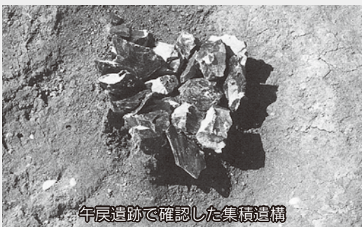
午辰遺跡で確認した集積遺構

市内には、腰岳の黒曜石 こくようせき に関する遺跡が数多くあります。その中には、黒曜石の原石や、石器を作り出す前の原石に近い状態のもの、数多くまとまっている遺構（集積遺構）が確認されたものがあります。午辰遺跡 うまてし （大坪町）は、