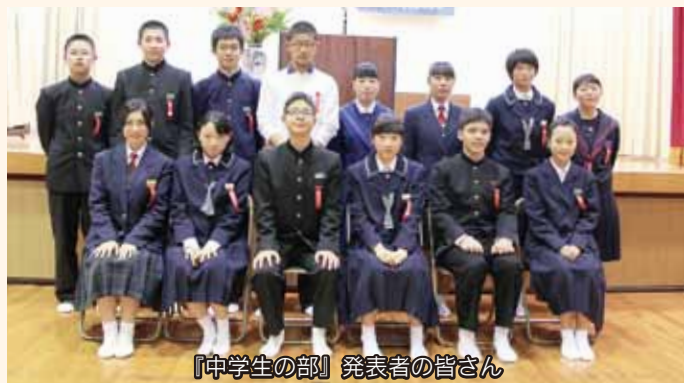
『中学生の部』発表者の皆さん