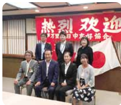
↑市日中友好協会の歓迎夕食会