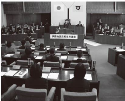
↑壇上から質問する伊万里農林高校の生徒

伊万里・有田地区の高校6校から各代表4人が議員となり、一般市政に対する質問をしました。内容は、中心市街地の活性化や災害時の福祉避難所の整備といった市の課題に対する提案など多岐にわたるもの。各質問に対し、塚部芳和市長や森 哲也教育長など執行部は、実現の可能性や