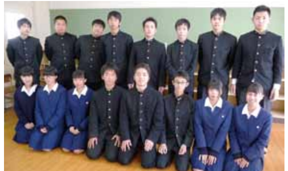
↑司会・進行を務める伊万里農林高校生徒会の皆さん