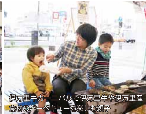
伊万里牛カーニバルで伊万里牛や伊万里産食材のバーベキューを楽しむ親子