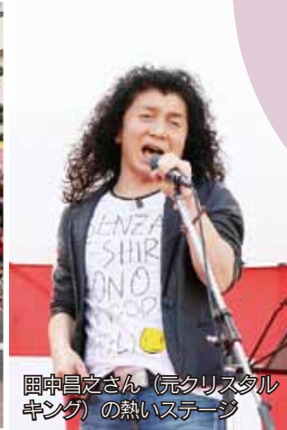
岡中昌之さん（元クリスタルキング）の熱いステージ