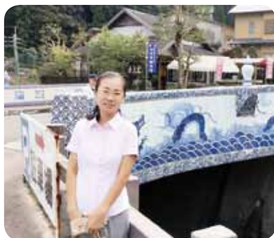
↑大川内山の美しさに感動しました