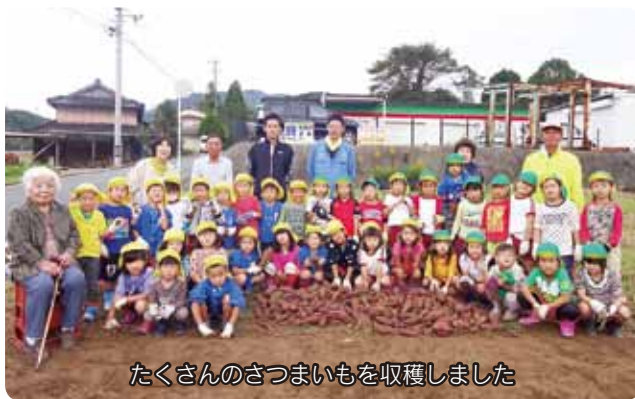
たくさんのさつまいもを収穫しました

10月、芋掘りをしました。夏の暑い盛りに、おばあちゃんたちがつる返しをしてくれたので、驚くほど大きな芋が出てきました。子どもたちは、掘るたびに歓声を上げ、泥んこになって芋掘りを楽しみました。10月31日、園庭で焼き芋会をしました。さつまいもを新聞紙で包み、ぬらしてからアルミホイルで包みました。自分たちで植え付けた芋を掘って、焼き芋の準備をしたことで、子どもたちは自給自足の大変さと楽しみに触れる体験ができました。これからも、作ってくれた人への感謝の気持ちを持てるような食育活動に取り組んでいきたいと思えます。