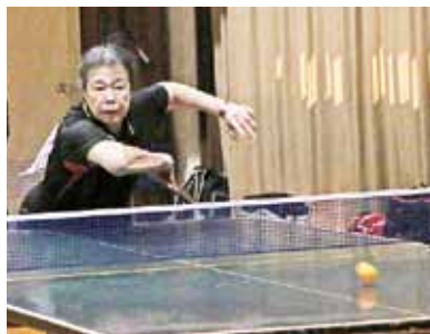
↑会場のあちらこちらで力強いスマッシュが決まっていました