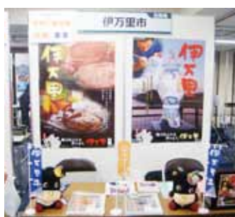
↑ 東京都で開催された九州・沖縄合同移住フェアに出展

移住する前に、市の風土や日常生活を事前に知ってもらうことも大切です。移住を希望している人に伊万里市での生活を体験してもらうため、移住体験住宅が利用できます。