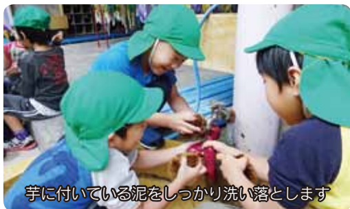
芋に付いている泥をしっかりと洗い落とします

6月に年長・年中組の子どもたちが、借りている畑に芋苗の植え付けをしました。初めて経験する子どもたちが多かったものの、地域のおばあちゃんたちから丁寧に教えてもらい、上手に植えることができました。