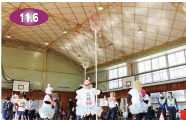
↑各チーム思い思いの衣装で競技に挑む玉入れ選手権の出場者