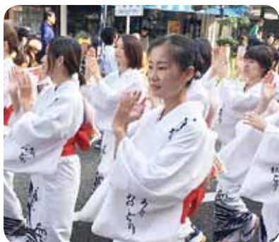
↑いまり秋祭りの『市民総踊り』に参加

これから1年間、真面目に研修に取り組み、伊万里市のいいところを探していきたいと思っています。皆さん、どうぞよろしくお願ひします。