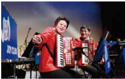
↑人権コンサートの社会福祉法人JOY明日への息吹 障害福祉サービス事業所JOY倶楽部ミュージックアンサンブル