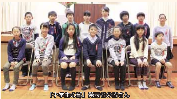
『小学生の部』発表者の皆さん