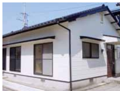
↑ 移住活動の拠点として利用できる移住体験住宅