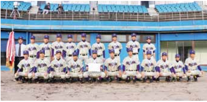
↑逆転劇で優勝旗を手にした敬徳高校野球部