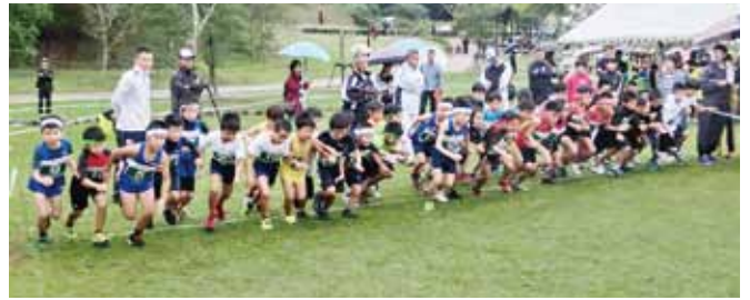
↑一斉にスタートする小学生男子1・2・3年生の部の出場者