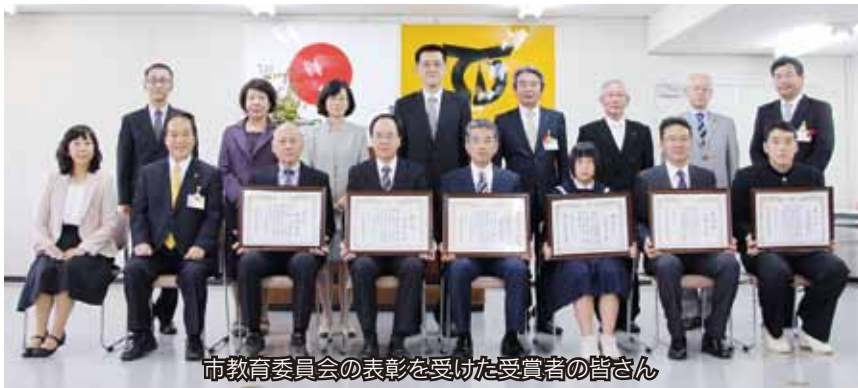
市教育委員会の表彰を受けた受賞者の皆さん

11月14日、市役所で伊万里市教育委員会表彰がありました。これは、文化の日になんで、教育や学術、文化、体育の向上に大きく貢献した人に対し、市教育委員会が毎年表彰を行っているものです。今回は、5人と1団体が受賞しました。