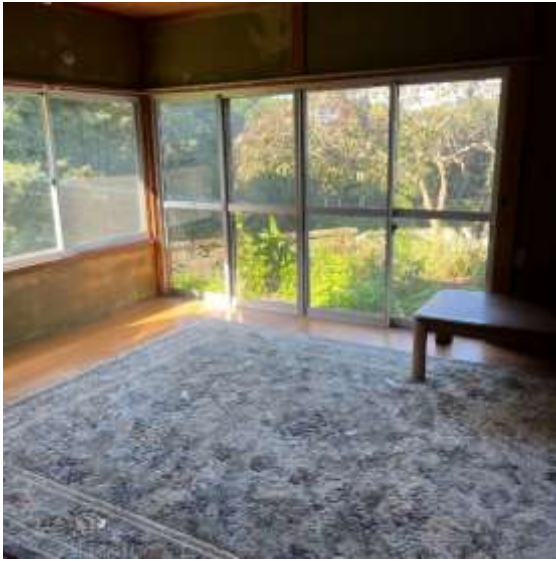
【洋室 8 帖】