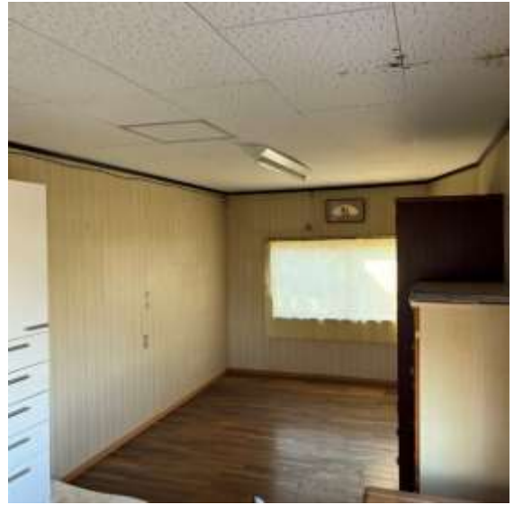
【洋室 9.5 帖】