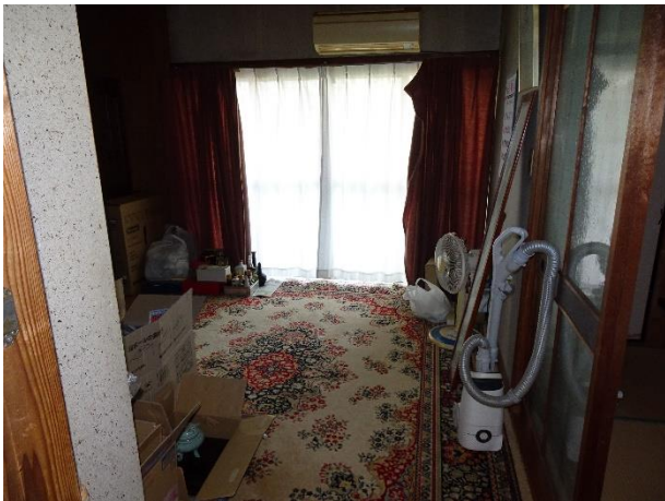
【洋室 8 帖】