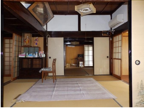
【和室 6 畳、4.5 畳】