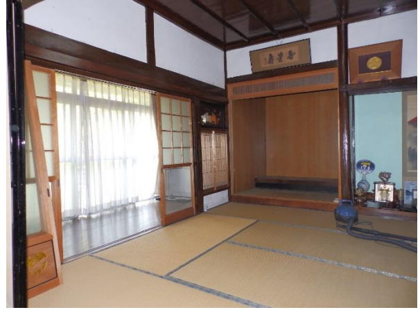
【和室 8 畳】