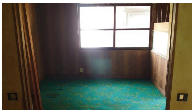
【別棟 洋室 4.5帖】