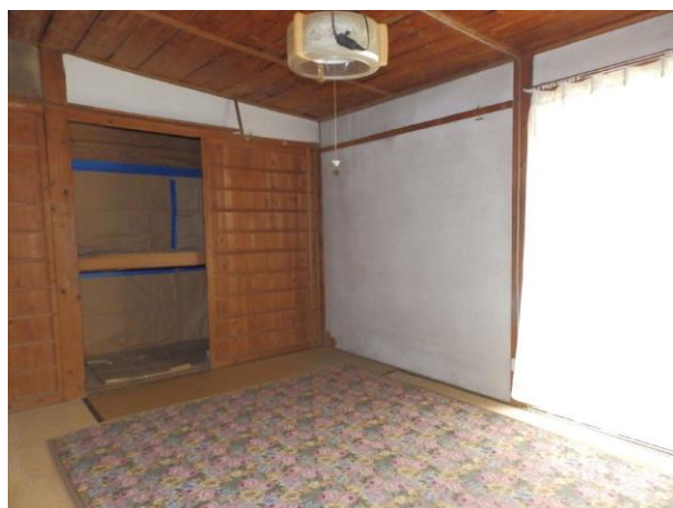
【和室 6 畳】