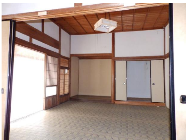
【和室 8 畳】