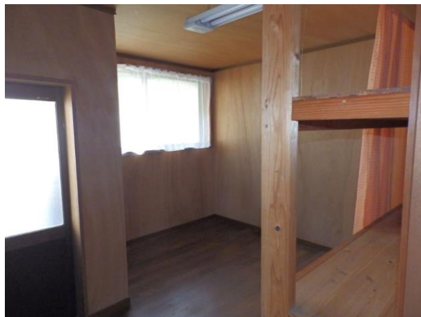
【洋室 4 畳】