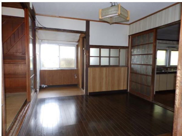
【洋室 4.5 畳】