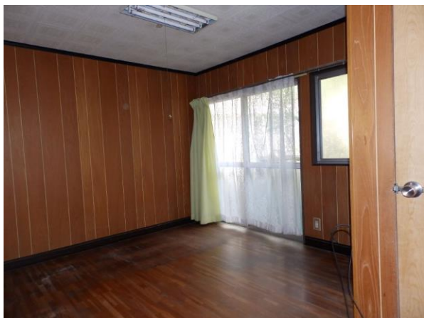
【洋室 5.5 畳】