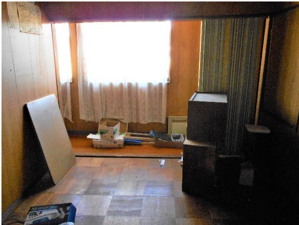
【2階 洋室 4.5帖】