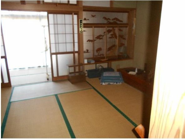
【和室 8 帖】