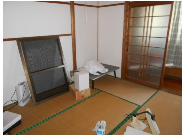
【2階 和室 6帖】