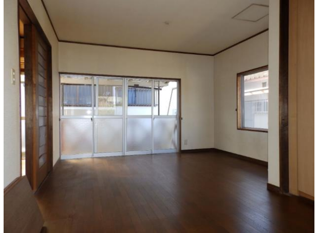
【洋室 7.5 畳】