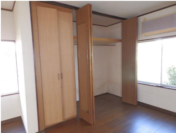
【洋室 7.5 畳 収納】