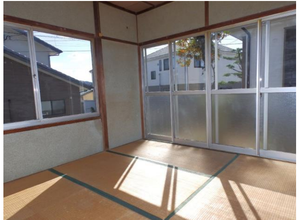
【和室 4.5 畳】