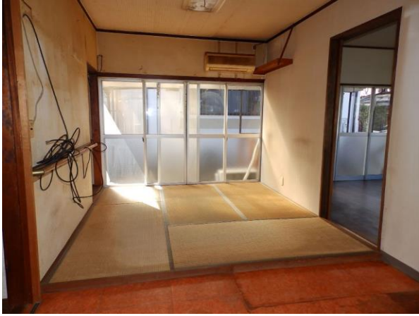
【ダイニング横 4.5 畳】