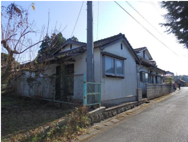
【前面道路からの外観】