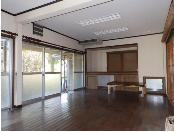
【洋室 11.25 畳】