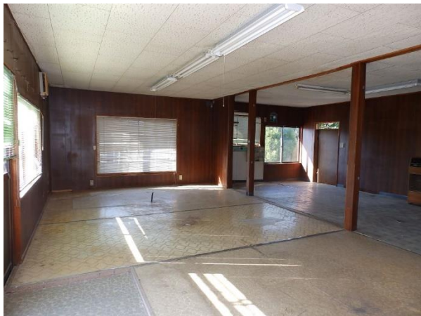
【附属建物 2階フロア】