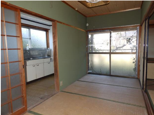
【和室 4 畳】