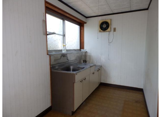
【ミニキッチン 3.5 畳】