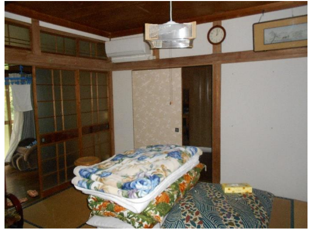
【和室 6 帖】