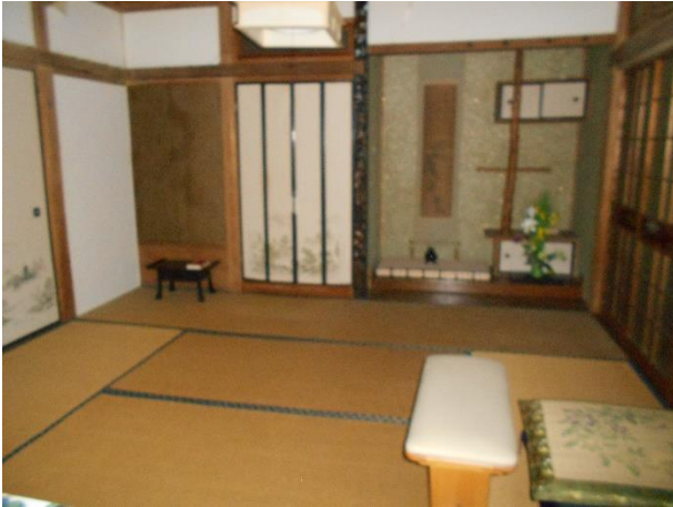
【和室 6 畳】