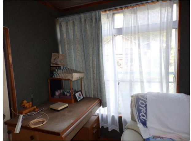
【洋室 4.5 帖】