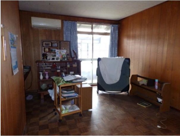
【洋室 5.5 帖】