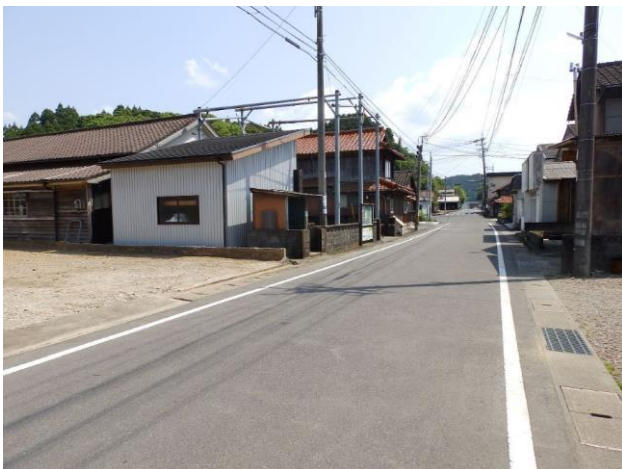
【西側前面道路(西側)】