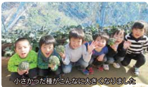
小さかった種がこんなに大きくなりました

毎年夏野菜の収穫が終わると、園庭のプランターでブロッコリーを育てます。8月24日、みんなで種をまきました。大きさは、わずか2～3ミ。小さいのでつかみ損ねて落としてしまう子どももいました。かなり真剣です。