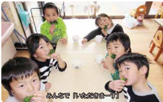
みんなで『いただきます』

数日後、「小さな芽が出ているよ」と一人が知らせに来ると、みんな急いで見に行き「本当だ」と声を上げて喜んでいました。それが今や、ソフトボールくらいの大きさにまで成長しています。大きくなったブロッコリーは、随時収穫して給食にして食べています。子どもたちは、小さな種から大きく成長するまでの過程を観察することができました。また、夏の水掛けや青虫取りなど、自分たちが世話をすることで野菜に対する抵抗感が無くなり、野菜が好きになる子どもが増えているようです。これからも、こうした食育活動を子どもたちと一緒に楽しみながら続けていきます。