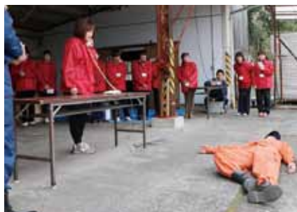
↑ 目の前に人が倒れている場面を想定した119番通報の訓練

限界であることなど、対応のポイントを解説しました。参加者は真剣な表情で講義に耳を傾け、学んだことを実技訓練で実践。緊急時の迅速かつ的確な対応の大切さなど、消防の知識を深めた1日となりました。