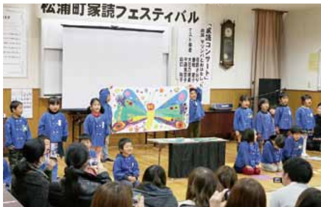
↑松浦保育園児による『はらぺこあおむし』の読み聞かせ