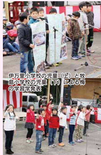
伊万里小学校の児童（上）と牧島小学校の児童（下）による梅の学習発表