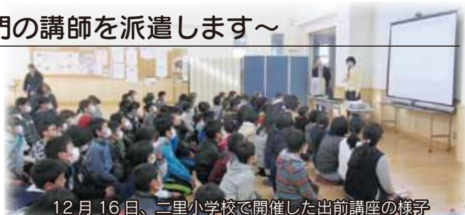
12月16日、二里小学校で開催した出前講座の様子

中学生からは、「契約のことを学べて良かった」、「自分も立派な消費者だということを実感した」、「SNS 上での誤解からいじめにつながるがあるので、投稿するときは注意したい」などの感想が、高校生からは、「これから社会に出る自分たちにとって、とても大切な話だった」、「インターネットはとても便利だが、ネットを利用したトラブルや詐欺がよく起こるようになったことを再認識した」、「ネットショッピングは、クーリング・オフができないことを知らなかった」などの感想が寄せられました。