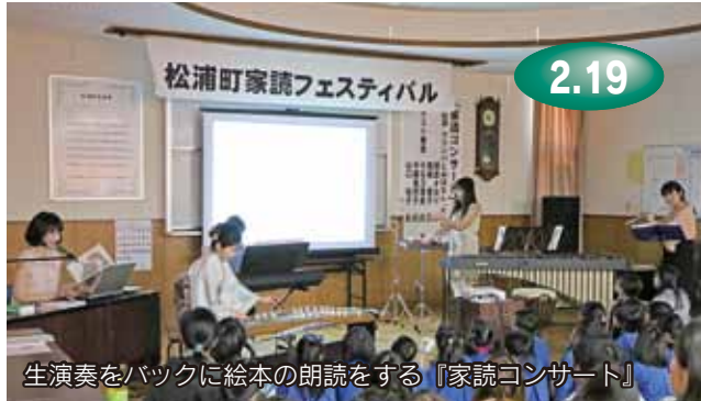
生演奏をバックに絵本の朗読をする『家読コンサート』

地域や家庭に家読の輪を広げようと、松浦公民館で松浦町家読フェスティバルがありました。マリimbaとおはなし“haha”による家読コンサートや松浦保育園、松浦小学校などによる家読の実践発表、松浦町誌の紹介などが行われました。発表者は読み聞かせや絵本の世界の表現など、趣向を凝らした演出で来場者を楽しませていました。