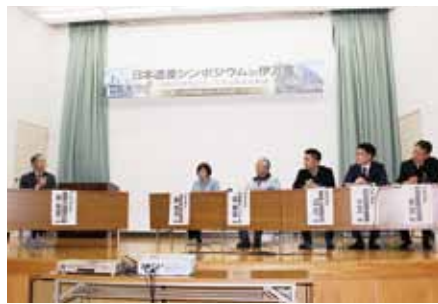
↑肥前窯業圏の今後の展望などを討議したパネルディスカッション

ディスカッションが行われ、若者に歴史に興味を持ってもらうためのアイデアなど活発な意見が交わされました。