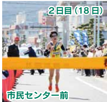
2日目(18日) 市民センター前