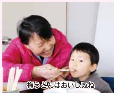
梅うどんはおいしいね