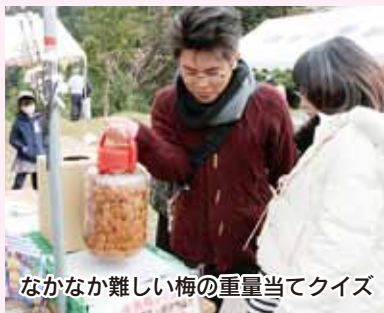
なかなか難しい梅の重量当てクイズ