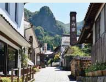
↑ストーリーの構成文化財の一つである大川内山

市内にあるストーリーを構成する要素としては、陶磁器窯跡や大川内山、旧犬塚家住宅（現陶器商家資料館）、伊万里神社にある旧戸渡嶋神社の灯籠などがあります。