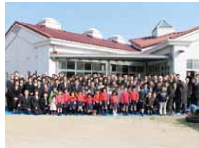
↑式には卒園者や地域の住民などが大勢駆けつけ、思い出の園舎と記念撮影

思い出を語る会では、園児によるお別れの言葉や、開園から閉園までの歴史を振り返るスライドショーのほか、園