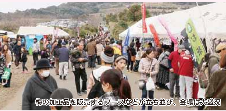
梅の加工品を販売するブースなどが立ち並び、会場は大盛況

2月26日、木須町の伊万里梅園（藤ノ尾）で伊万里梅まつりがありました。これは、西九州一の広さを誇る梅の産地をPRし、多くの人に梅を身近な食材として感じてもらうと、JA伊万里が毎年開催しているものです。この日は、市内の小中学生による梅の学習発表や梅の種とぼし大会のほか、梅サイダーの早飲み大会などさまざまな催しが行われました。梅の香りが漂う会場には、市内外から多くの人々が訪れ、早春の日ざしを浴びて咲き誇る白や紅色の花を満喫し、一足早い春の訪れを楽しんでいました。