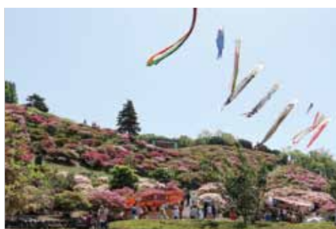
↑5万本のつつじが咲く会場の竹の古場公園