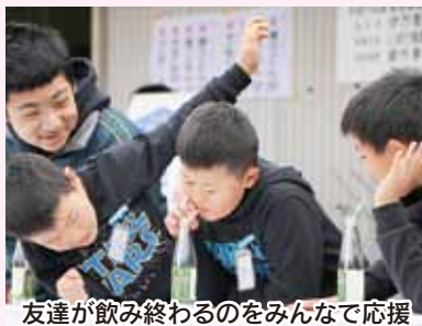
友達が飲み終わるのをみんなで応援