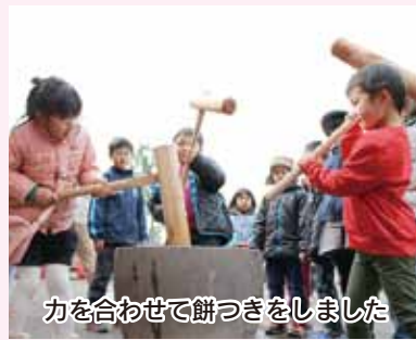
力を合わせて餅つきをしました