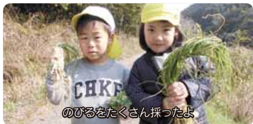
のびるをたくさん採ったよ

園では、子どもたちが心豊かに育つよう、身の回りの豊かな自然を生かした食育に取り組んでいます。園の周りは、自然がいっぱい。1日の生活の中で子どもたちが楽しみにしているのが、散歩です。