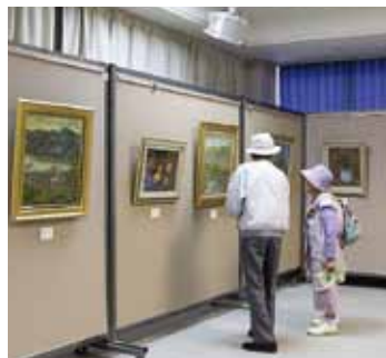
↑『絵画の部』展示の様子(昨年)