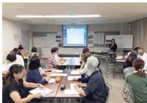
↑男女協働参画の視点から防災学習会を開催