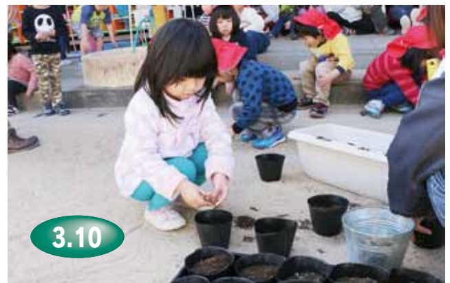
↑まいたどんぐりは2年間で50～60センチに成長するそう