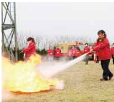
↑ 消火器を使った初期消火の訓練

3月6日、伊万里消防署で『女性1日消防官』が実施されました。これは、春の火災予防運動に合わせ、防火や防災に関する意識を高めてもらうと、実施されたものです。この日は、市防火協会と市危険物安全協会の会員事業所の女性従業員21人が参加。火災発生時の行動や救急救命に関する講義のほか、消火器を使った初期消火や、煙の中の避難を想定した濃煙体験、火災や救急の通報のしかたの実技訓練が行われました。 講義では消防署の職員が、火災を発見したときには『慌てず、落ち着いて』を心がけること、消火器を使った初期消火は火が天井に届くまでが