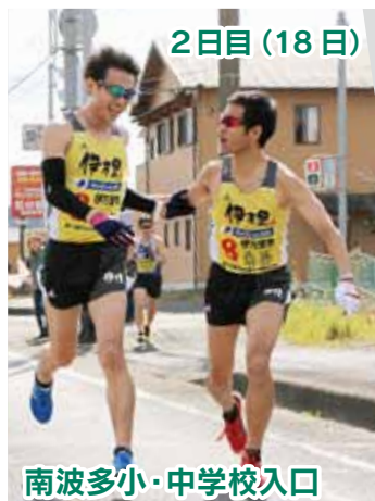
2日目(18日) 南波多小・中学校入口