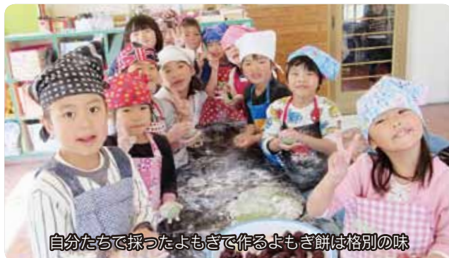
自分たちで採ったよもぎで作るよもぎ餅は格別の味

どんなに寒くてもへっちゃら。「のびるをたくさん採ってきたよ」、「これはね、ふきのとうっていうんだよ」、「このつくし、かわいいでしょ」と、たくさんのお土産を抱えて元気に園に帰ってきます。そこで、ふきのとうやのびるは山菜みそに、つくしは卵とじにしました。身近に自生する山菜がおいしい料理に生まれ変わったことに驚きつつ、初めて味わう野山の恵みに春を感じた子どもたち。よもぎはゆでて、つきたてのお餅に混ぜ合わせ、卒園のお祝いのお餅として、皆さんに配りました。