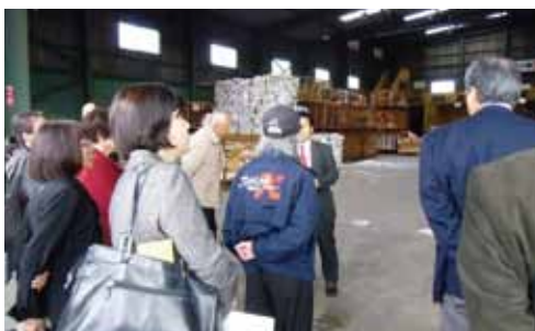
↑ リサイクル施設視察研修の様子（平成28年11月・江北町）