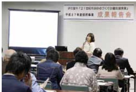
↑平成28年4月14日の報告会の様子