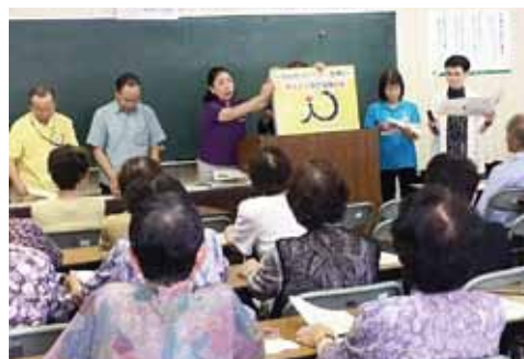
↑男女協働参画に関する紙芝居による出前講座