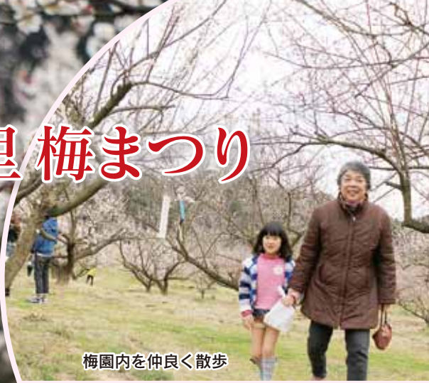
梅園内を仲良く散歩

2月26日、木須町の伊万里梅園（藤ノ尾）で伊万里梅まつりがありました。これは、西九州一の広さを誇る梅の産地をPRし、多くの人に梅を身近な食材として感じてもらうと、JA伊万里が毎年開催しているものです。この日は、市内の小中学生による梅の学習発表や梅の種とぼし大会のほか、梅サイダーの早飲み大会などさまざまな催しが行われました。梅の香りが漂う会場には、市内外から多くの人々が訪れ、早春の日ざしを浴びて咲き誇る白や紅色の花を満喫し、一足早い春の訪れを楽しんでいました。