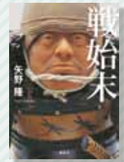
『戦始末』 矢野 隆 / 著 講談社

刻々と変化する戦場。やむなく敗戦となり撤退するとき、主や仲間を守るため、殿軍を受け持つ者たちがいます。攻め寄せた敵を相手に、全滅を覚悟しての撤退戦。生還を果たせるか、それとも討ち死にか、激しい撤退戦の中、見事殿軍としての務めを果たした男たちの物語です。