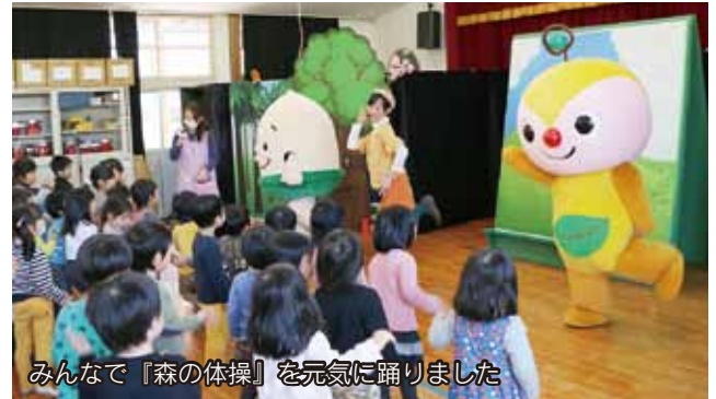
みんなで『森の体操』を元気に踊りました

みなみ保育園で、緑のリレープロジェクト『森の教室』がありました。これは、子どもたちに森の大切さを知ってもらおうと、公益社団法人国土緑化推進機構などが全国を巡回しながら実施しているものです。キャラクターショーや体操、どんぐりを土にまく体験などを通して、園児たちは森の役割などを楽しみながら学んでいました。