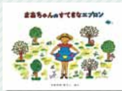
『まあちゃんのすてきなエプロン』 たかどの ほうこ / 作 福音館書店

お母さんが、3つのポケットがあるエプロンを縫ってくれました。赤、黄、ピンクのポケットには同じ色のハンカチが入っています。まあちゃんは、エプロンをして、丘の上に出かけます。「すてきなエプロン、エプロン」。まあちゃんが楽しく歌っているとき、子猿がまあちゃんの赤いハンカチを見つけて欲しくなりました。