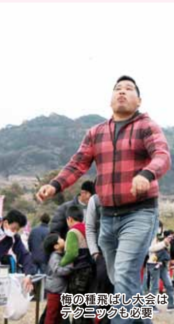
梅の種飛ばし大会はデクニツクも必要