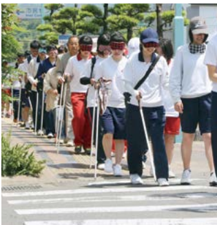
↑慎重に横断歩道を渡る参加者

途中で交代しながら、駅前や中央交番前を経由して市民図書館まで歩いた参加者たち。視覚障害者の日常を体験することで、障害に対する理解を深めました。