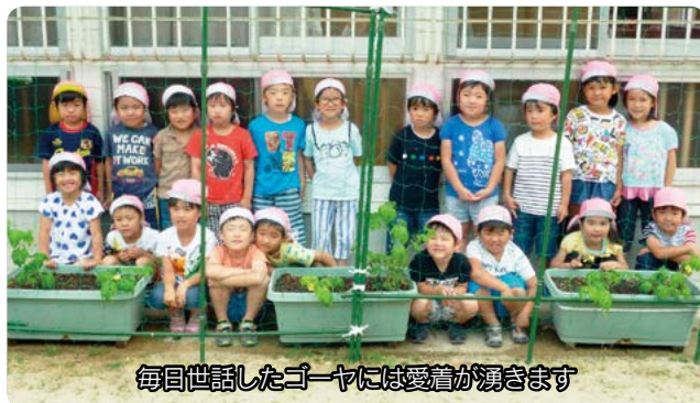
毎日世話したゴーヤには愛着が湧きます

ど、育てて調理し、食べるまでの工程を実践しています。園で育てる夏野菜の一つにゴーヤがありますが、緑のカーテンとしても活用できることから、夏には欠かせないものとなっています。ゴーヤはたくさんの水がいるので、朝・夕は年長児みんなで協力しながら水かけをします。ゴーヤが苦手な子どもも毎日世話をすることで愛着を感じ、食べてみたいと思うようになるようです。8月には夏野菜カレー作りがあります。どんなカレーが出来るのか、今から楽しみにしています。