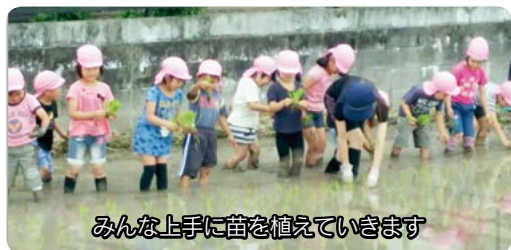
みんな上手に苗を植えています

園では、毎月19日は食育の日として、年齢に合わせた食育に関する活動を行っています。主な活動としては、菜の花を育てて菜種油をしぼることや、夏野菜でのカレー作り、田植え・稲刈りをした米でのおにぎり作りな