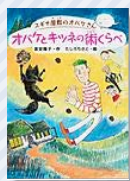
『スギナ屋敷のオバケさん オバケとキツネの術くらべ』 富安陽子/作 たしろちさと/絵 ひさかたチャイルド

スギナ屋敷には、オバケさんとオバケたちが住んでいます。オバケさんはあだ名で、オバケたちはオバケさんを自分の仲間だと思っています。ある日、オバケさんは仕事を終え、山の中を車で帰ってきましたが屋敷の入り口が見えません。それは山に住む悪地悪なスミルギツネの仕業。なんとオバケさんに術くらべを挑んできたのです。