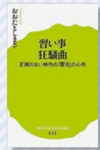
『習い事狂想曲』 おおたとしまさ/著 ポプラ社

この本は、『習活』＝習い事に関して親がやらなければならない一連の活動について書かれています。豊富な経験を積ませようと、子どもにどんな習い事をさせたらよいかと悩む親は多いはず。知識量や思考力、表現力など幅広い能力が求められる時代だからこそ、現代の習い事の常識と現実を理解した上で、子どもの習い事を選びませんか。