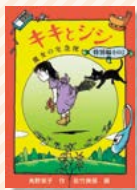
~魔女の宅急便 特別編 その2~ 『キキとジジ』 角野米子/作 佐竹美保/画 福音館書店

オキノさんと魔女のコキリさんに女の子が生まれました。名前はキキ、みんなはとも喜びます。ある日、コキリさんがドアを開けると、真っ黒い子猫が揺りかごに飛び乗りました。黒猫の名はジジ、ふたりはいつも揺りかごの中で、くっついて寝ていたのです。キキが生まれてジジと一緒に日に日に大きくなるころ、ふたりはどんな毎日を送っていたのでしょうか。