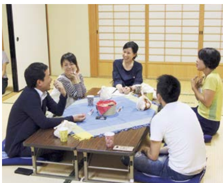
最初は少し緊張していた皆さんですが、すぐに打ち解けて笑いの絶えない座談会になりました。

私もやらないといけないなと思うんですけど、なかなかね。どうやっていいかわからないし。