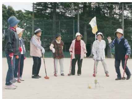
↑笑顔で和気あいあいとプレー

▽ 3 位 山代東部第1 (山代町) ▼ 準優勝 宿分 (松浦町) ▼ 優勝 黒川B (黒川町) ◆ 上位成績 ● 場 所 国見台球技場 ● 期 日 10月5日