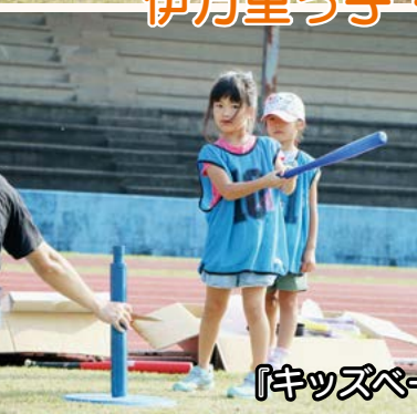
『キッズベースボール』