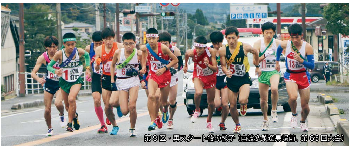
第9区・再スタート後の様子 (南波多梨選果場前、第63回大会)