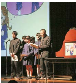
↑ 昨年のフォーラムの様子

高校生が発信する人権イベ ント『ハートフルフォーラム』 を、今年も敬徳高校の生徒が 主体となって開催します。 ●日 時 12月1日(金) 午後0時55分 ●場 所 市民会館 ●内 容 ▽オープニングDVD上映 ▽人権に関する意見発表 ▽デートDV防止啓発紙芝居 ▽「これって愛?」気付こう デートDVD」