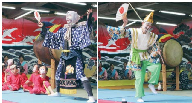
↑ かわいい子どもたちが演じる『猿まわし』