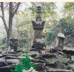
↑ 松浦党の党祖を祀る山ノ寺遺跡 (東山代町)

的なものとしては、鎌倉時代の元寇があります。大陸の元王朝から従属を迫られた鎌倉幕府が、これを拒否したことよって始まった文永の役と弘安の役において、松浦党の諸氏は元の熾烈な攻撃に真っ先にさらされながら果敢に戦ったことが資料に残されています。このように中世において、伊万里湾とその周辺の地理的重要性は、それ以前の時代から飛躍的に増し、そこで活動する人々の姿も明らかになっています。