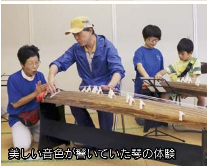
美しい音色が響いていた琴の体験