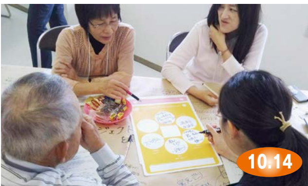
↑面白いアイデアが次々と出されていました(写真は第3回)

まちへの思いやまちづくりのアイデアなどを市民が自由に語るワールド・カフェ方式のワークショップ『いまりん café』がありました。これは、市が策定する第6次市総合計画に市民の意見を反映するため、市民との協働によるまちづくりを進める機会として全3回開催したものです。参加者は思い思いにこれからの伊万里について語り合いました。