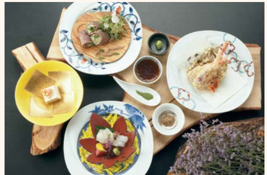
↑フェアで提供される料理のイメージ