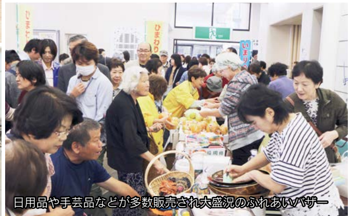
日用品や手芸品などが多数販売され大盛況のふれあいバザー

市民会館でボランティアまつりがありました。これは、市民との交流を通じてボランティア活動を推進するため、市ボランティア連絡協議会と市社会福祉協議会が毎年開催しているものです。市内のボランティア団体などにより、ステージ発表や体験コーナーなど多彩な催しが行われ、雨模様にも関わらず多くの来場者でにぎわっていました。