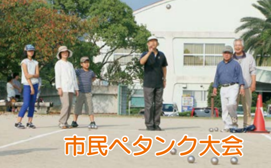
市民ペタンク大会