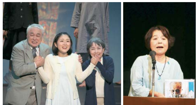
↑ めぐみさんが帰国し両親と手を取り合う日がくることを表現した場面