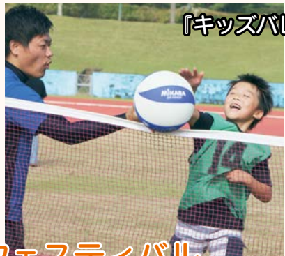
『キッズバレーボール』