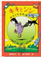
~魔女の宅急便 特別編 その2~ 『キキとジジ』 角野米子/作 佐竹美保/画 福音館書店

オキノさんと魔女のコキリさんに女の子が生まれました。名前はキキ、みんなはとても喜びます。ある日、コキリさんがドアを開けると、真っ黒い子猫が揺りかごに飛び乗りました。黒猫の名はジジ、ふたりはいつも揺りかごの中で、くっついて寝ていたのです。キキが生まれてジジと一緒に日に日に大きくなるころ、ふたりはどんな毎日を送っていたのでしょうか。