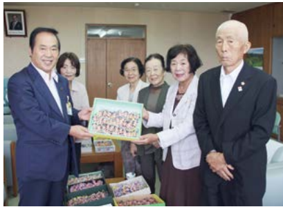
↑贈呈したマスコットと市老人クラブ 連合会の皆さん

9月19日、市老人クラブ連 会女性部の皆さんが、交通安 全マスコット人形400個を 市に贈呈しました。今年で25 回目となり、市の交通安全キ ャンペーンなどで配布予定です。