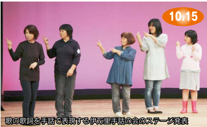
歌の歌詞を手話で表現する伊万里手話の会のステージ発表