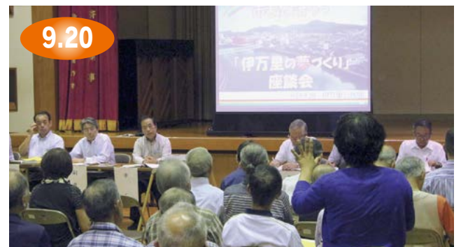
↑子どもが遊びの中で心と体を育てていく施設が必要だと意見を述べる参加者(伊万里公民館)

伊万里公民館と山代公民館で、市長と語ろう『伊万里の夢づくり』座談会がありました。伊万里公民館では松島搦地区への道の駅設置や大型商業施設の誘致、子どもの遊び場の整備など、山代公民館(9月27日)では浦之崎地区廃棄物処理用地の産業用地への変更や、山代公民館の移転整備などについて、活発な意見交換がありました。