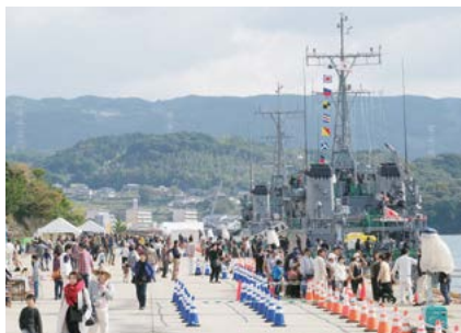
自衛隊掃海艇一般公開 (3・4日)

ふだんは入ることができないコンテナターミナル。コンテナを船から積み下ろす作業の様子を見学できました。