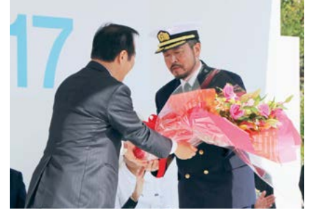
入港セレモニー (3日)

カトリック幼稚園の園児の元気なマーチングで開幕。今回寄港した船舶の入港セレモニーが行われました。