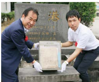
開港記念タイムカプセル開封 (6月1日)

50年前、開港を記念して埋設されたタイムカプセルを開封。埋設した当日の新聞や写真など当時を記す貴重な資料が次々に取り出され、関係者からは歓声が上がりました。