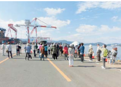
伊万里港コンテナターミナル見学会 (3・4日)

カトリック幼稚園の園児の元気なマーチングで開幕。今回寄港した船舶の入港セレモニーが行われました。