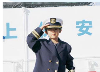
海上保安庁巡視船一般公開 （3・4日）

さまざまな可能性を秘め、利用分野が広がり続けているドローンの操縦体験。コツをつかめば誰でも操縦可能です。