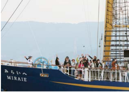
帆船『みらいへ』港内クルージング (3・4日)

社団法人グローバル人材育成推進機構の帆船『みらいへ』。波穏やかな伊万里湾内を優雅にクルーズしました。