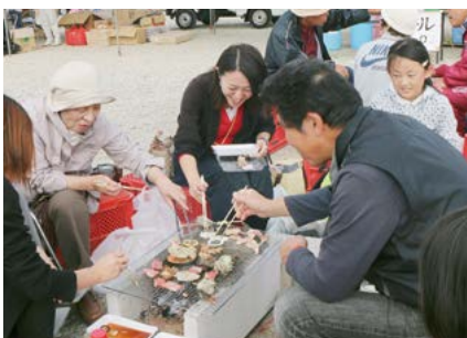
波多津みなと祭り（3、4日）

毎年波多津漁港で開催される波多津みなと祭りを会場を移して開催。名産の力キや伊万里牛などに舌鼓を打ちました。