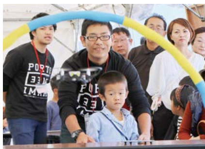
ドローン体験コーナー（3・4日）

開港 50 周年記念歌『伊万里港』などを突き抜ける美声で力強く歌い上げ、大勢の観客を魅了しました。