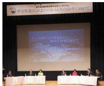
記念シンポジウム (9月23日)

伊万里港の歴史を振り返りつつ、これからの伊万里港を考えるシンポジウムを開催。開港当時の市の担当者の講演や、有識者によるパネルディスカッションなどが行われました。