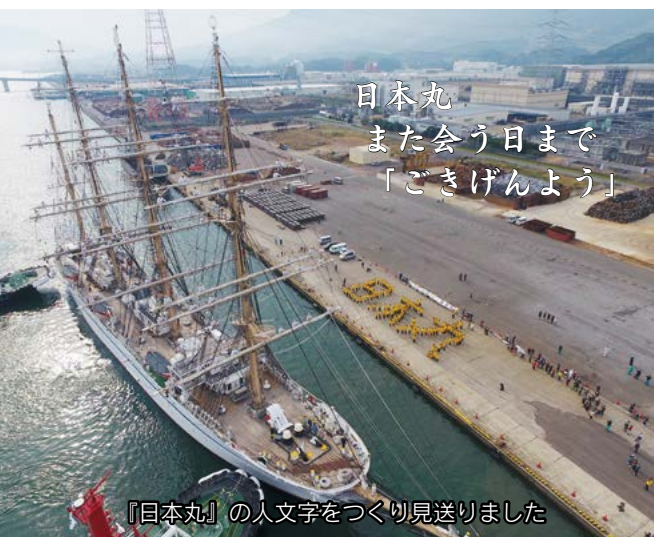
日本丸の登しょう礼（7日）

子どもたちなどが企業の作業現場の壁に、思い思いの絵を描いていました。どれも個性あふれる力作ばかり。