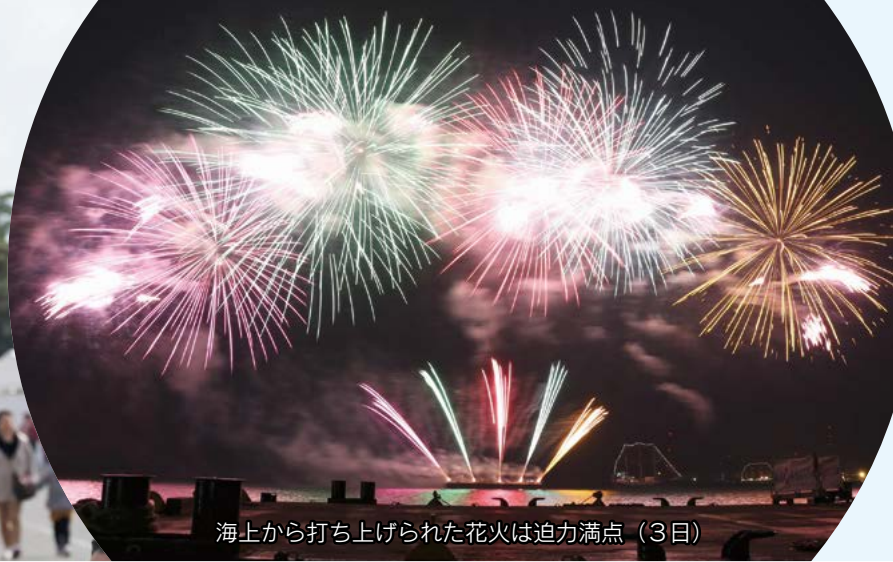
海上から打ち上げられた花火は迫力満点（3日）