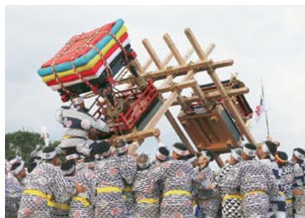
伊万里トントン模擬合戦（4日）

巡視船『まつうら』が一般に公開。海上保安庁の制服を着て船の前で撮影できるサービスも行われていました。