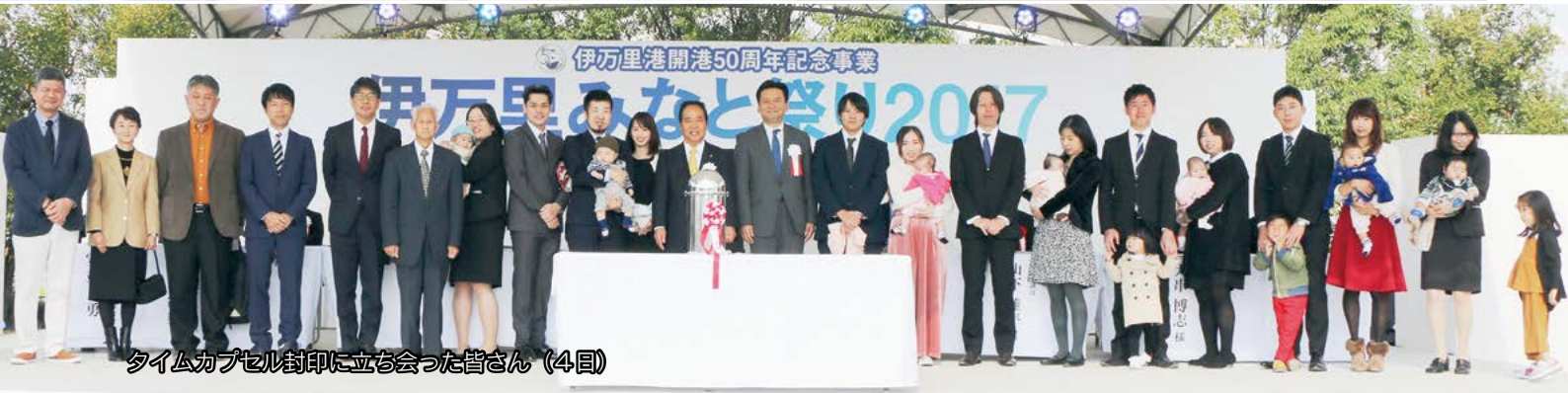
タイムカプセル封印に立ち会った皆さん（4日）