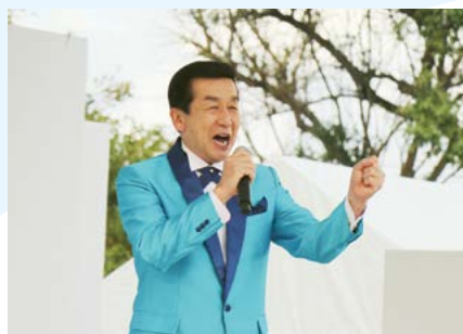
池田輝郎歌謡ショー（4日）

開港 50 周年記念歌『伊万里港』などを突き抜ける美声で力強く歌い上げ、大勢の観客を魅了しました。