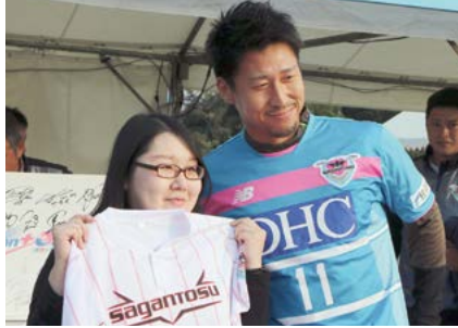
株式会社サイゲームス特設ブース (3・4日)

同社のゲームコンテンツ展示、キックターゲット、サガン鳥栖の選手のサイン会などが行われました。