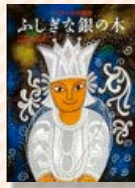
『ふしぎな銀の木』 ~スリランカの昔話~ シビル・ウェッタシンハ / 再話・絵 松岡享子・市川雅子 / 訳 福音館書店

昔、不思議な夢を見た王様がいました。地面から美しい銀の木が生え、枝には銀の花が咲き、銀の実がなったのです。王様は、三人の王子たちに「旅に出て、あの木を持ち帰った者を次の王とする」と言いました。王子たちは驚きましたが、何日も旅を続け、三本の分かれ道にやってきました。そこで三人は…さて王子たちは銀の木を探して持ち帰ることができるのでしょうか。