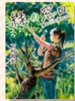
『緑の窓口 樹木トラブル解決します』 下村敦史 / 著 講談社

区役所に勤める天野は、環境対策課『緑の窓口』に異動し、住民の樹木トラブルの相談を受けることになりました。初日の依頼は「スギの木を伐採してほしい」というもの。現場で天野は、樹木医を名乗る女性・終紅葉に出会います。「全ては樹木が語ってくれました」と言って、彼女はスギの木を伐採することになった真相を解き明かしていきます。6つの連作ミステリー。