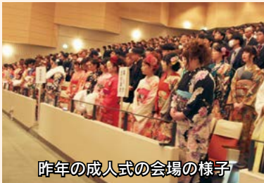
昨年の成人式の会場の様子