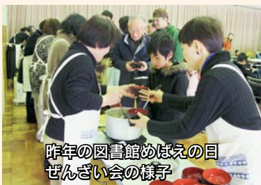
昨年の図書館めばえの日 ぜんざい会の様子

25日(日) ▷ぜんざい会〔ホール〕 午前11時 ※先着300食 ▷古本市〔洋会議室〕 午前10時～午後2時