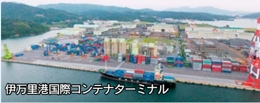
伊万里港国際コンテナターミナル