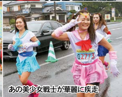
あの美少女戦士が華麗に疾走