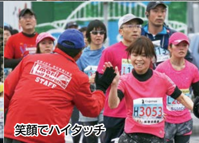
笑顔でハイタッチ