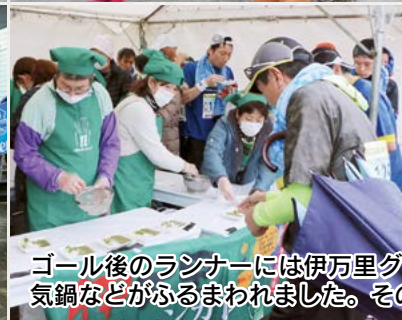
ゴール後のランナーには伊万里グリーンカレーや伊万里牛元氣鍋などがふるまわれました。その味は格別。