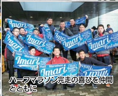
ハーフマラソン完走の喜びを仲間とともに