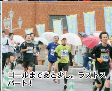
ゴールまであと少し。ラストスパート!