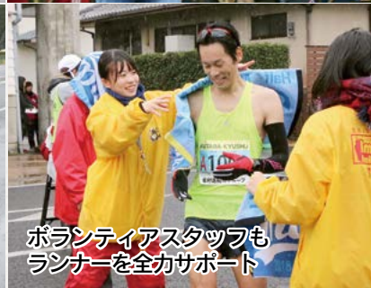
ボランティアスタッフもランナーを全力サポート