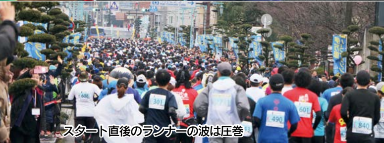
スタート直後のランナーの波は圧巻

1月8日、市街地や伊万里湾大橋を巡る『伊万里ハーフマラソン2018』が開催されました。全国から3,300人余りの市民ランナーが参加。ハーフ(21.0975 km )・10 km ・3 km のコースに分かれ、初春の伊万里路を爽快に走り抜けました。[12ページに関連記事を掲載しています]