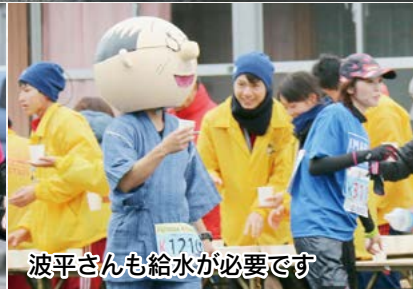
波平さんも給水が必要です