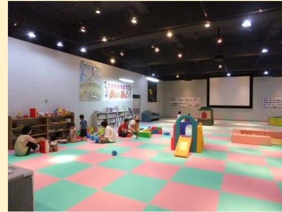
【キッズスペース「あいあい」】