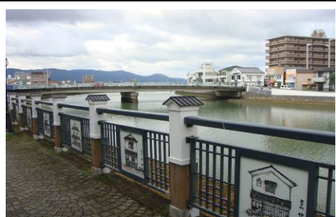
【あいあい通り】伊万里川河畔の散歩道。欄干には江戸時代の白壁土蔵家屋の絵が飾られています。