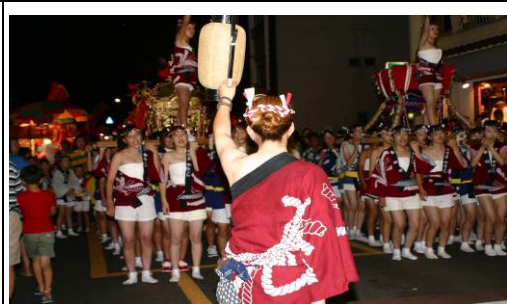
【どっちゃん祭り】伊万里津の賑わいを再現した女性のお祭りとして8月上旬に開催されます。