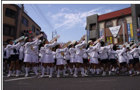
【伊万里秋祭り】10月下旬のトンテントン祭りに合わせ郷土色豊かな市民の祭りです。