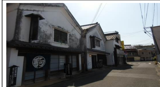
【陶器商家資料館・海のシルクロード館】白壁土蔵造りを復元整備した建物。古伊万里の歴史や文化に触れることができます。