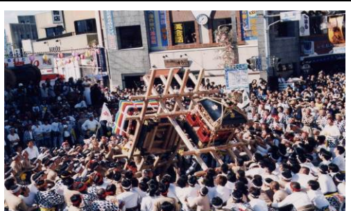
【トンテントン祭り】伊万里神社の御神幸祭で毎年10月下旬の3日間、勇壮な合戦が開催されます。