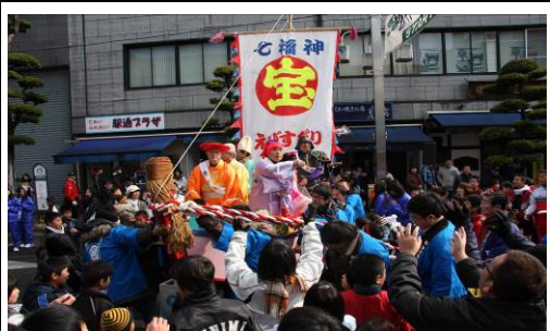
【えびす祭り】年初めに商店街活性化を目的として七福神パレードや福運抽選会などが行われます。