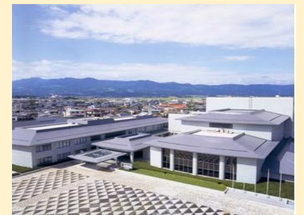
【伊万里市民センター】