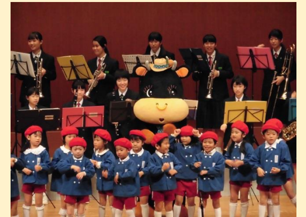
【ふれあいコンサート】