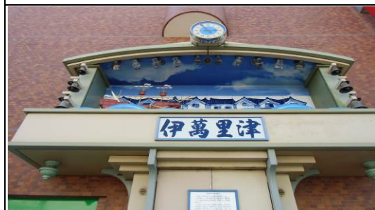
【万里音（まりおん）】古伊万里の積出港として栄えた伊万里津の賑わいを再現したからくり時計。