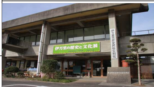
【歴史民俗資料館】古墳時代から近世にわたる郷土史の遺物、古文書資料などが展示されています。