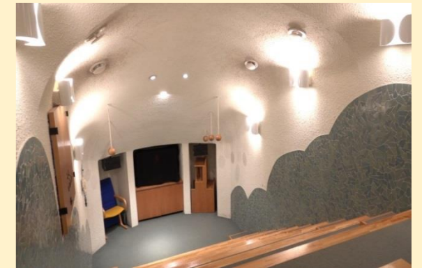
【市民図書館「のぼりがまのおへや」】