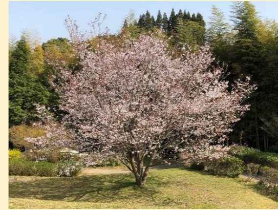
【都川内湖水公園付近の桜】