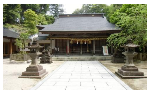
【伊萬里神社・中嶋神社】伊萬里神社はトントン祭りの氏神を祀る神社です。境内にはお菓子の神様を祀る中嶋神社もあります。