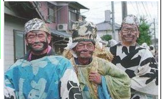
【古賀のつうわたし】今岳大権現の分霊を引き継ぐ伝統行事です。