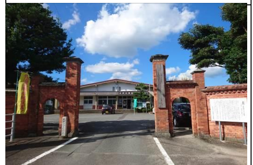
【赤門】東京大学の赤門になぞらい大坪小学校の校門として建立されました。