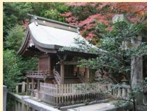
【お菓子の神様「中嶋神社」】