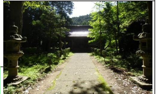
【今岳神社】18世紀頃に今岳頂上に建立され、イザナギノミコトとイザナミノミコトが祀られています。