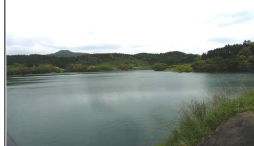
【都川内ダム】工業用水の水源確保のため平成14年に竣工した多目的ダムです。