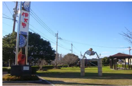
【森永公園】森永乳製品工場跡地に作られた森永公園には森永製菓の創業者森永太郎の銅像があります。