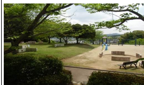
【円造寺公園】水道浄水場跡地で幼児用の遊具のほか、桜の時期は花見も出来る憩いの場所です。