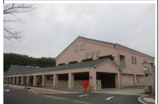
【伊萬里市民図書館】館内には、登り窯のお部屋などがあり、親子で楽しむことができます。