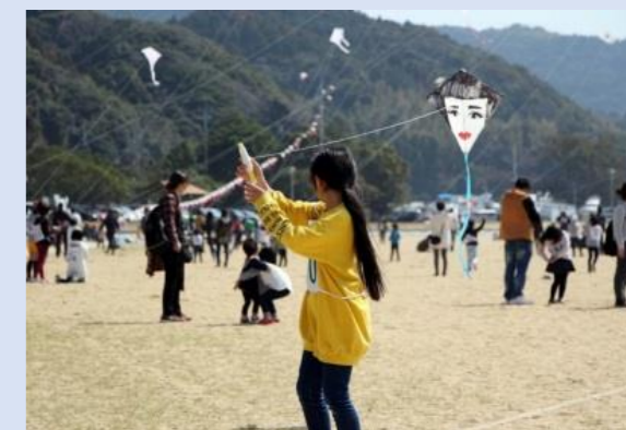
【西九州伊万里凧あげ大会】