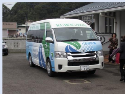
【巡回バスくろがわ号】