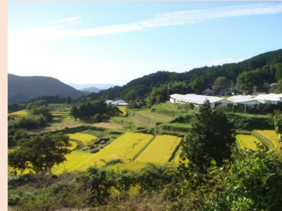
【大野岳からの景色】