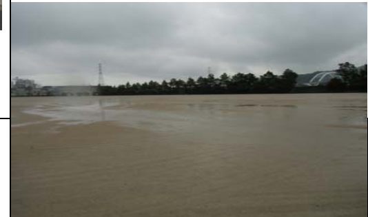
【伊万里湾大橋球技場】2面のフットボールが可能な広々とした運動場です。