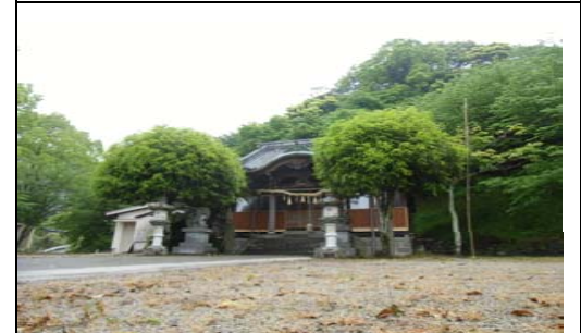
【飯盛神社】松浦党源直が久原西部の城山に飯盛城を築き、その守護神として久原の馬洗川に飯盛神社をまつたと伝わっています。