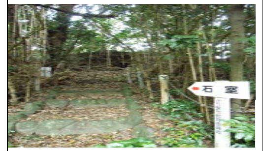
【小島古墳】6世紀中頃から後半に築かれた前方後円墳です。