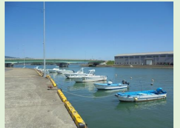
【浦ノ崎地区の海岸】