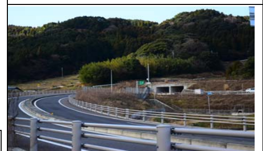
【西九州自動車道】長崎松浦方面に向かう自動車道です。