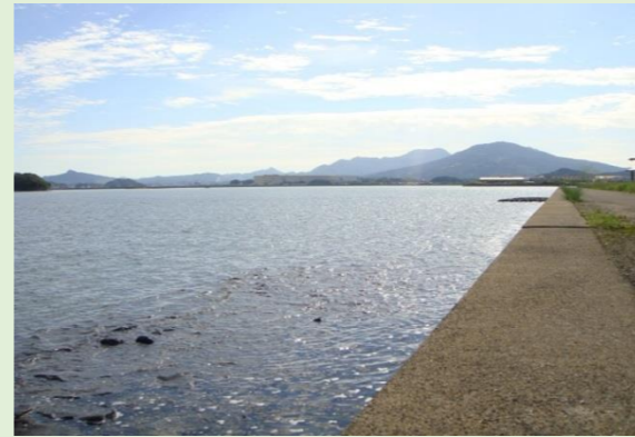
【楠久津公園付近の海岸】