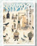
『チェコの十二月月』 - おとぎの国に暮らすー

2002年よりプラハに在住している著者が、現地で体験した復活祭、クリスマス、謝肉祭など季節を彩る風習や、人々との触れ合いなどを描いています。出久根氏の優しい挿絵と共に、約11年間の日々が春夏秋冬を通して語られています。歴史ある町の息づかいを感じられる一冊です。