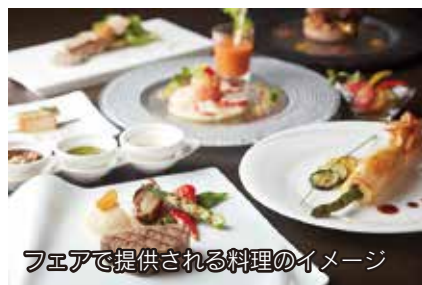
フェアで提供される料理のイメージ