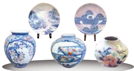
↑展示している絵皿や壺