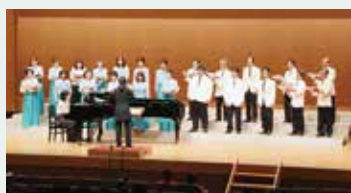
↑ 昨年の定期演奏会の様子