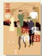
『集団探偵』 三浦 明博/著 講談社

転勤で東京に引越してきた流太は、『シエアハウス』になりました。個性あふれる住人たちには、みんなで探偵をしているという秘密があります。町で起こる数々の難事件に対し意見を戦わせる彼ら。最終的には土蔵に集まり、多数決で推理を決定し解決します。テンポよく進んでいく連作小説です。