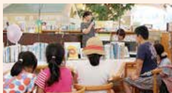
↑ 去年の☆まつり (おはなし会) の様子

～2っこり笑顔で3んなキラキラ～ 7日(土)、8日(日) 午前10時～午後4時 ※販売は8日の午後3時30分まで