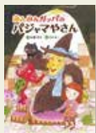
『あんみんガツパのパジャマやさん』 柏葉 幸子/作 そが まい/絵 小学館

あんみんガツパの店と呼ぶ不思議なパジャマやさんのパジャマは、とてもよく眠れるといわれています。カツパが大きなあくびをしている形の入り口ですが、誰も店の場所を知りません。モヨちゃんは店を見つけてきました。すると魔女が黒猫とやってきました。一緒に店の中へ入ると、突然カツパの口が閉じて、まっくらに。明かりがともり、ベシヤン、ベシヤンという音とともにやってきたのは…。